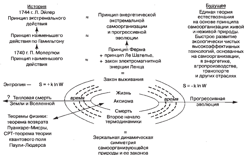
Рис. 1. Логическая схема связи основной сущности ЗВ, ВНТ, ПЭЭС и ПЭ с аксиомой жизни и смерти, феноменальными физико-химическими принципами и основными теоремами физики

На микро уровне это явление надежно обосновано: проф. МГУ А.П. Руденко анализом микроэволюции элементарных, открытых химических, каталитических систем; на молекулярном уровне - Г. Хакеном и М. Эйгеном. Лауреатом Нобелевской премии И. Пригожиным это явление самоорганизации обосновано аналитически и выражено в виде принципа минимизации удельного внутреннего производства энтропии. Этот принцип по своей сущности наиболее близок к сущности закона выживания, но выражен в энтропии, а не в свободной энергии. Г. Хакеном обоснован принцип подчинения синергетики. Его сущность подобна сущности математического приема сокращения переменных сложных систем. Однако, он не отражает самой сущности самоорганизации. В доступных публикациях автору не удалось найти обоснования ошибочности приписывания ВНТ и энтропии направляющей роли в эволюции и доказательству их истинной роли в этом процессе, а также аксиоматического обоснования ВНТ, ЗВ и их логической, концептуальной связи. Впервые это, по-видимому, осуществлено в работах автора