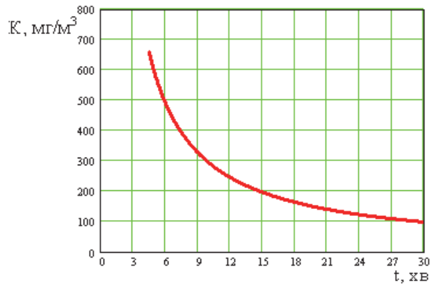
Рис. 2. Залежність часу експозиції при різній концентрації озону, що необхідний для забезпечення дози обробки 2940 \text{mg} \cdot \text{m}^3 /хв.

Також для побудови номограми необхідно було встановити залежність для визначення часу експозиції при різній концентрації озону, що необхідний для забезпечення дози обробки 2940 ( \text{mg} \cdot \text{m}^3 )/хв, яка забезпечує знешкодження 90 % шкідливих мікроорганізмів [7]. Встановлена залежність наведена на рис. 2. Параметри визначені для розробленої установки з відстанню між електродами 3см, діелектричними пластинами з поліетилену товщиною 0,5мм та напруги на електродах 16 кВ.