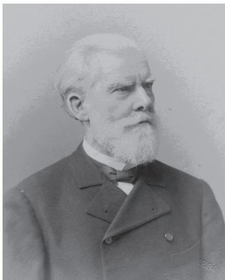
В.Ф. Грубе (1894 г.)

История харьковской медицины, предпосылки быстрого развития которой были заложены более 200 лет назад созданием Харьковского университета с медицинским факультетом, включает в себя много славных страниц. Одну из них вписал своей деятельностью выдающийся хирург, учёный, педагог, врач-общественник Вильгельм Фёдорович Грубе. С его именем связаны радикальные преобразования хирургии в нашем городе, которые включили новейшие для того времени и не утратившие поныне своего значения достижения науки: введение антисептики и асептики, внедрение полостных операций, резкое снижение послеоперационной летальности. По инициативе В.Ф. Грубе была создана прогрессивная организация – Харьковское медицинское общество, отметившее недавно своё 150-летие. Благодаря профессору Грубе медицинский факультет Харьковского университета получил средства на постройку четырёх клиник, что сделало возможным