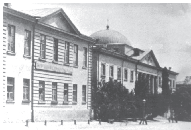
Университетский флигель (слева), в котором располагались первые клиники медицинского факультета (справа университетская церковь)