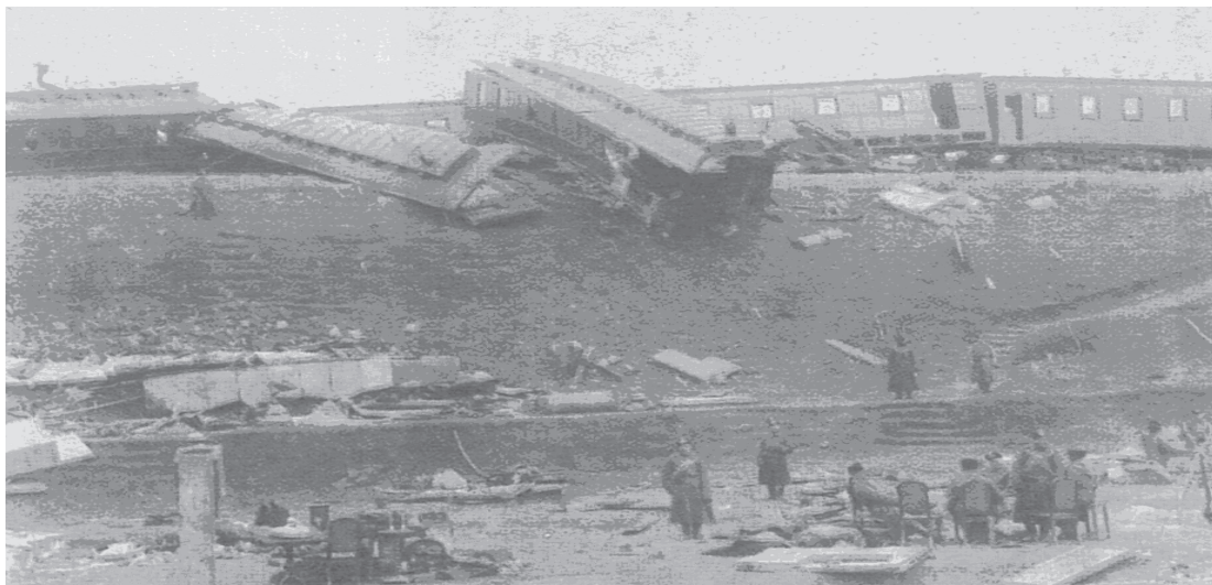
Место крушения императорского поезда