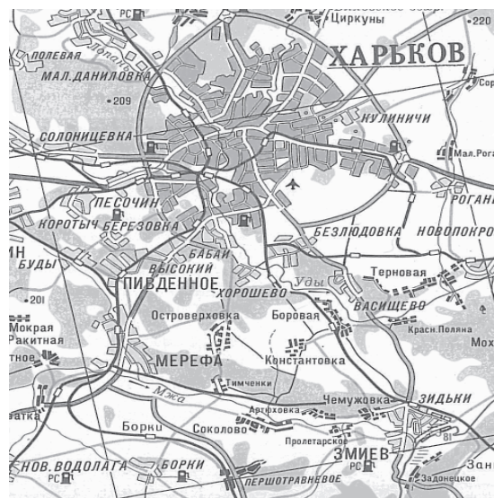
Карта Харьковской области (в левом нижнем углу станция Борки)