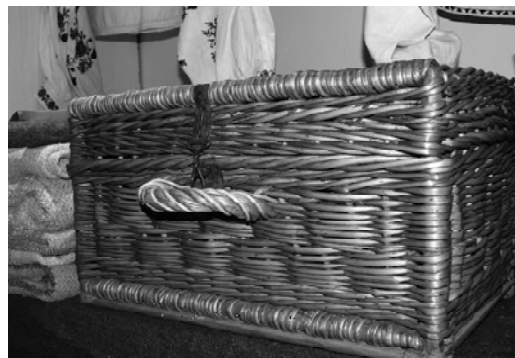
Рис 4. Плетена валіза; Сумський обласний краєзнавчий музей. Фото 2009 р.