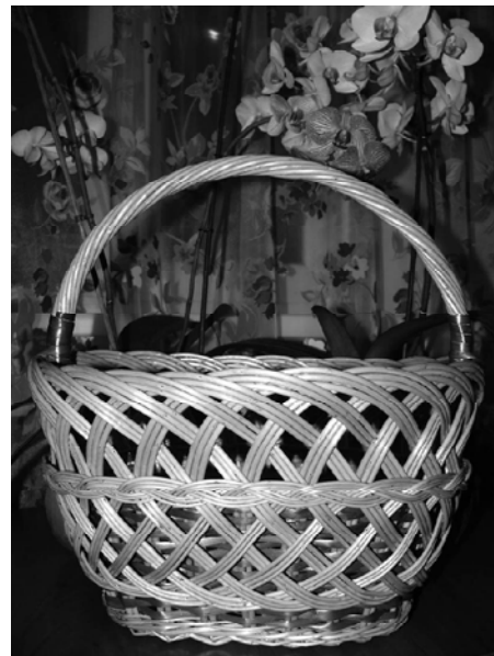
Рис. 7. Кошик для освячення паски, майстер А. Михайлик; с. Боромля Тростянецького р-ну Сумської обл. Фото 2014 р.