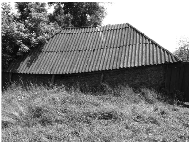
Рис. 1. Господарська споруда із плетеними стінами; с. Сахни Конотопського р-ну Сумської обл. Фото 2009 р.