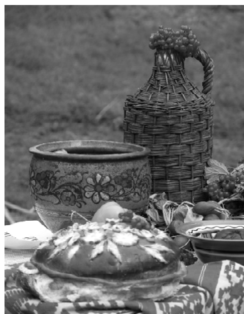
Рис. 5. Плетений короб із однією ручкою для скляної ємкості; Обласний благодійний фестиваль «Ми діти твої, рідний краю!» (с. Попівка Конотопського р-ну Сумської обл. Фото 2012 р.