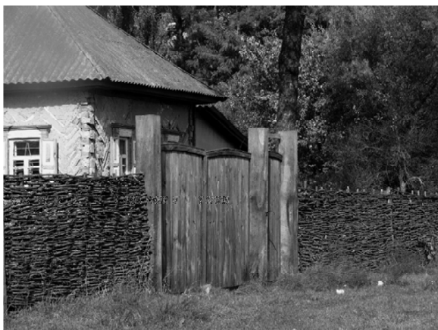
Рис. 3. Плетений паркан – ліса в оформленні передньої частини селянського подвір'я; с. Гути Конотопського р-ну Сумської обл. Фото 2007 р.