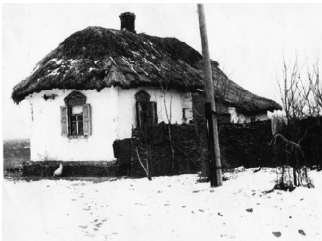
Рис. 2. Селянська хата із плетеною призьбою та тином, I пол. XX ст.; с. Вирівка Конотопського р-ну Сумської обл.