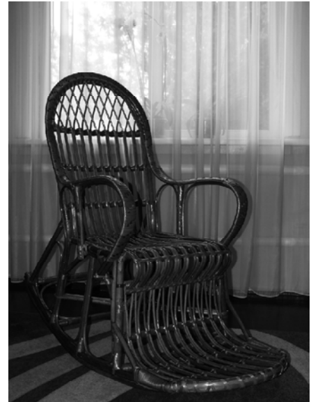
Рис. 13. Плетене крісло-гойдалка, майстер А. Михайлик; с. Боромля Тростянецького р-ну Сумської обл., 2010 р. Фото 2013 р.