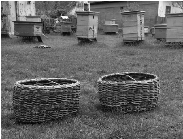
Рис. 10. Господарські кошики для збирання картоплі; с. Бочечки Конотопського р-ну Сумської обл. Фото 2009 р.