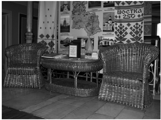
Рис. 12 Плетені меблі Боромлянської лозомеблевої фабрики; Сумський обласний краєзнавчий музей. Фото 2009 р.