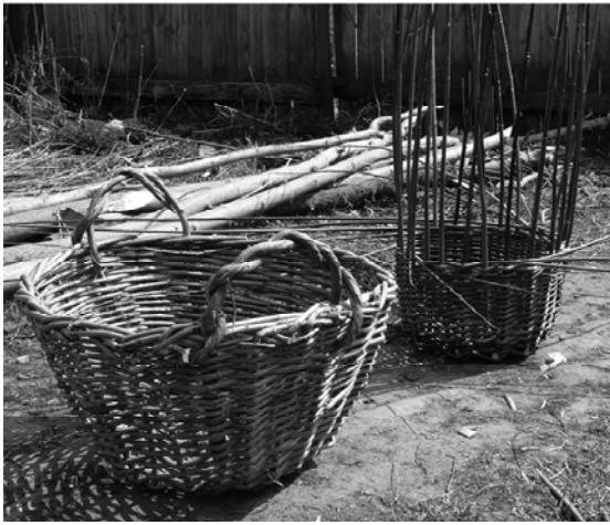
Рис. 9. Господарський кошик із двома вухами і недоплетений кошик на одну ручку, майстер В. Книш; с-ще Заводське Конотопського р-ну Сумської обл. Фото 2009 р.