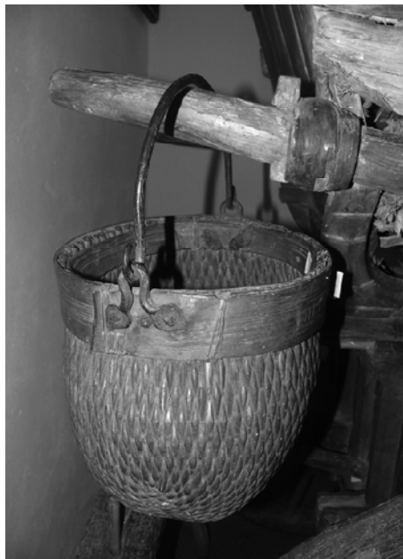
Рис. 6. Плетене відро, XIX ст.; Роменський краєзнавчий музей. Фото 2009 р.