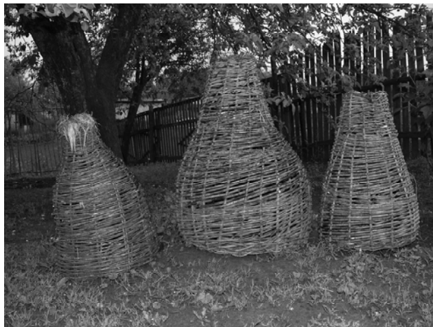
Рис. 11. Плетені із верболозу верші; с. Заводське Конотопського р-ну Сумської обл. Фото 2009 р.