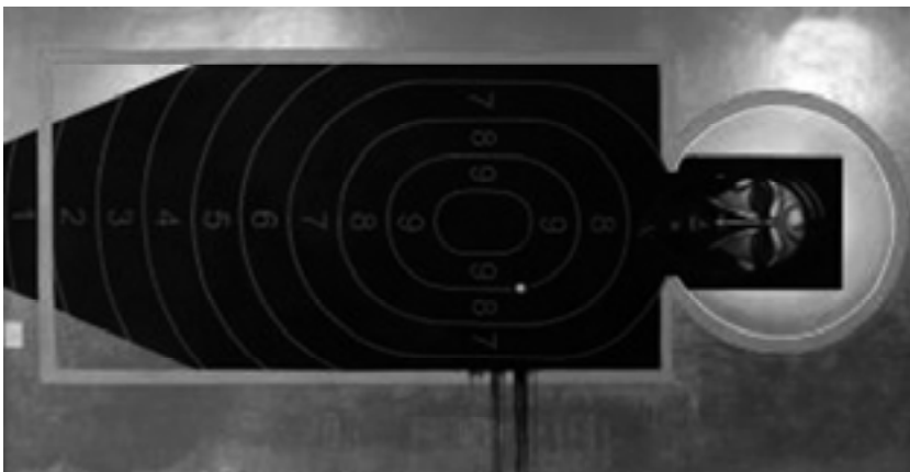
Мал. 15. Львів, 2014 р.