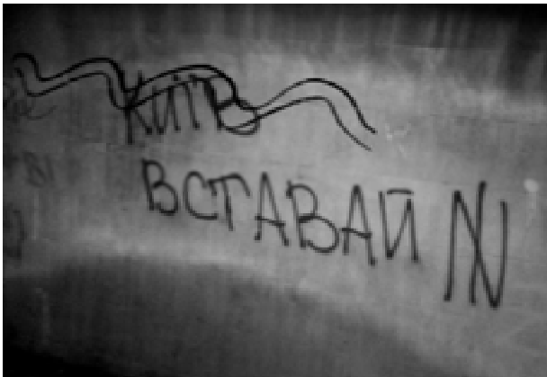
Мал. 6. Європейська площа, підземний перехід. Квітень 2014 р.