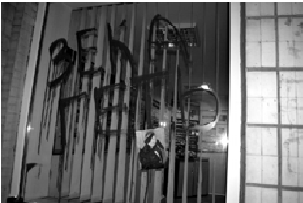
Мал. 1.

Революційні графіті – творіння народу у переломні історичні часи, тому кожне слово і малюнок створювався з великим емоційним підтекстом. У них – заклик до боротьби, пошук ідеалів, зневіра у владі, схилення голови перед загиблими героями. Крім того, такі графіті є своєрідним способом ведення важливого діалогу, який об'єднує людей.