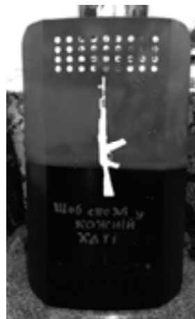
Мал. 12. Вул. Хрещатик, 2014 р.