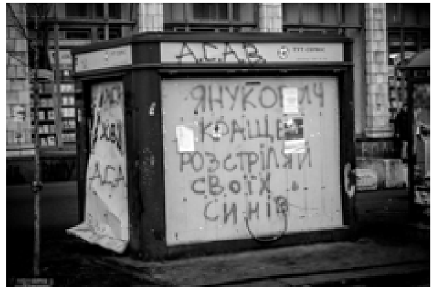
Мал. 3. Вулиця М. Грушевського, березень 2014 р. Фото Артема Турченко.