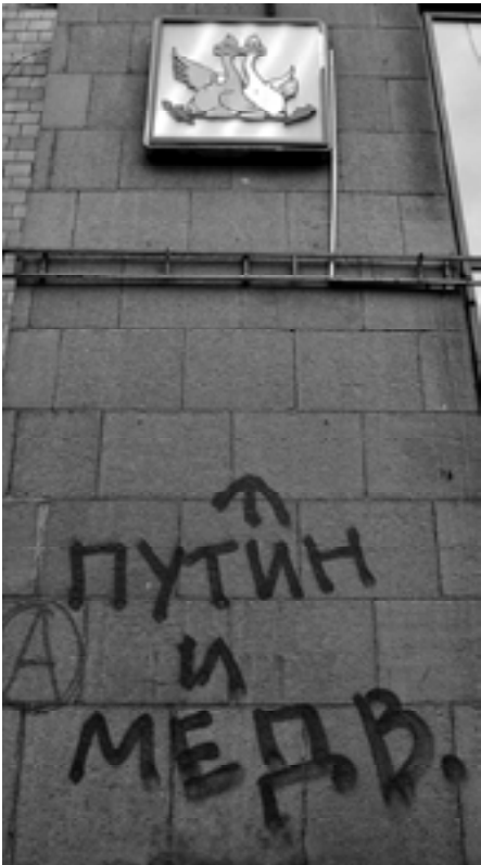
Мал. 13. Вул. Хрещатик. Березень 2014 р.