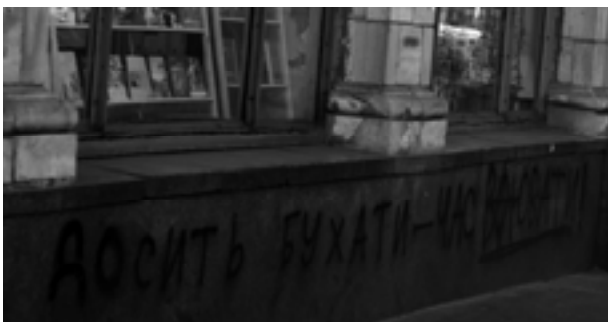
Мал. 8. Вул. М. Грушевського, квітень 2014 р.