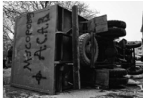
Мал. 9. Лютий 2014 р.