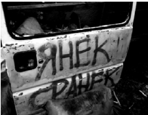
Мал. 2. Вул. Хрещатик, 2014 р.