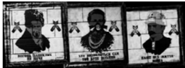
Мал. 10. Вул. Хрещатик, 2014 р.