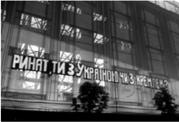
Мал. 5. Вул.Хрещатик, ЦУМ. Квітень 2014 р.