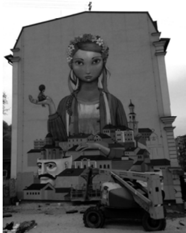
Мал. 14. Андріївський узвіз. Березень 2014 р.