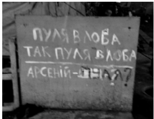
Мал. 4. Майдан Незалежності, березень 2014 р.