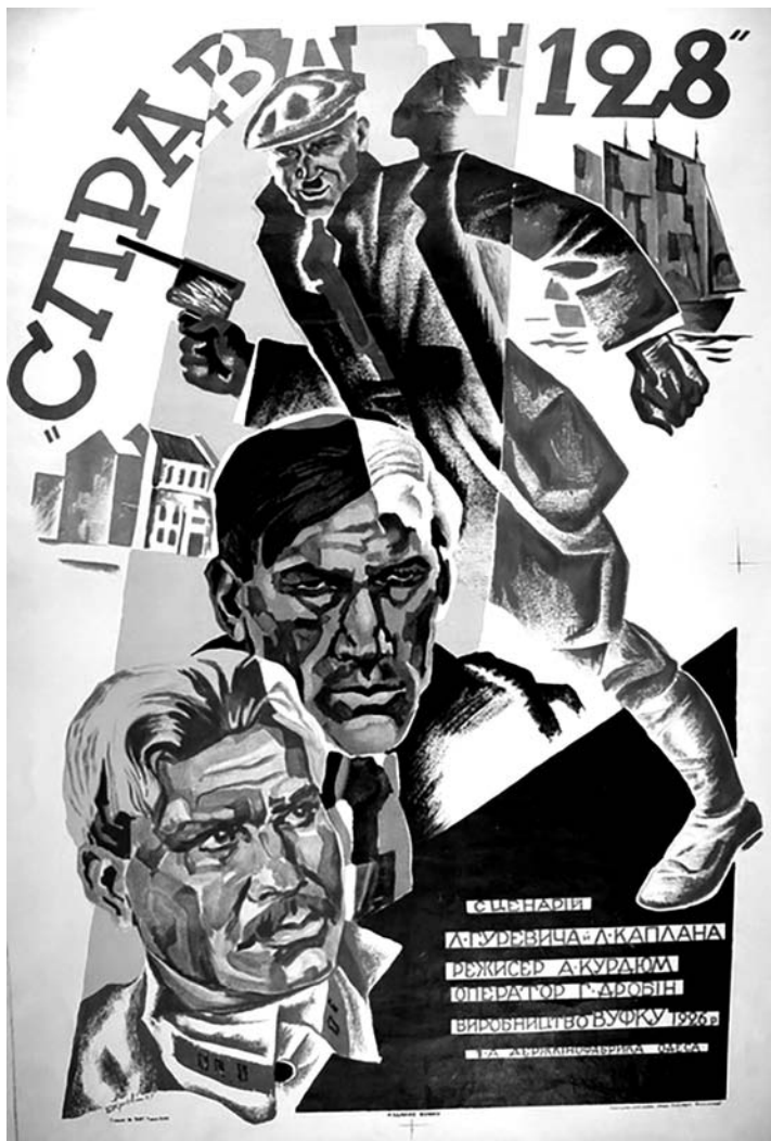
«Справа № 128». Кіноплакат. (1927). Художник невідомий.