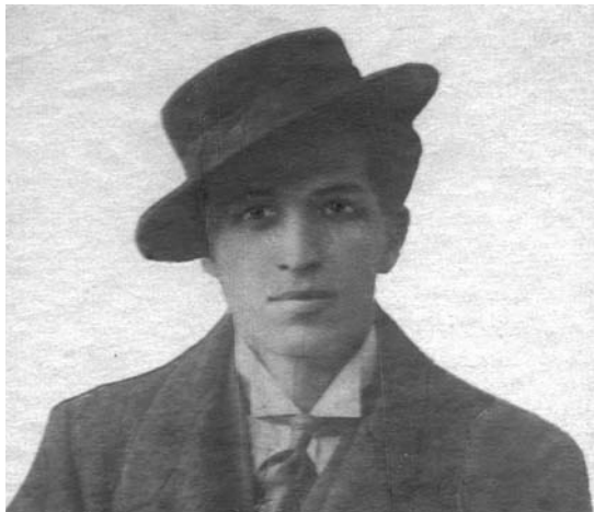
Арнольд Кордюм. Фото 1911 року.