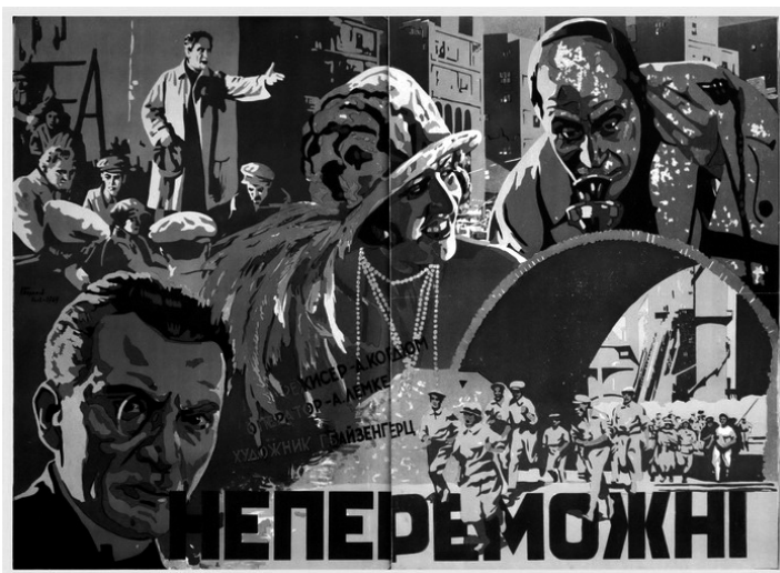
«Непереможні». Кіноплакат. (1927). Художник К. Болотов.

Вирізка з газети з рецензією на фільм «Непереможні».