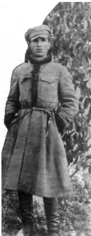
Кисловодськ, 1918 рік.