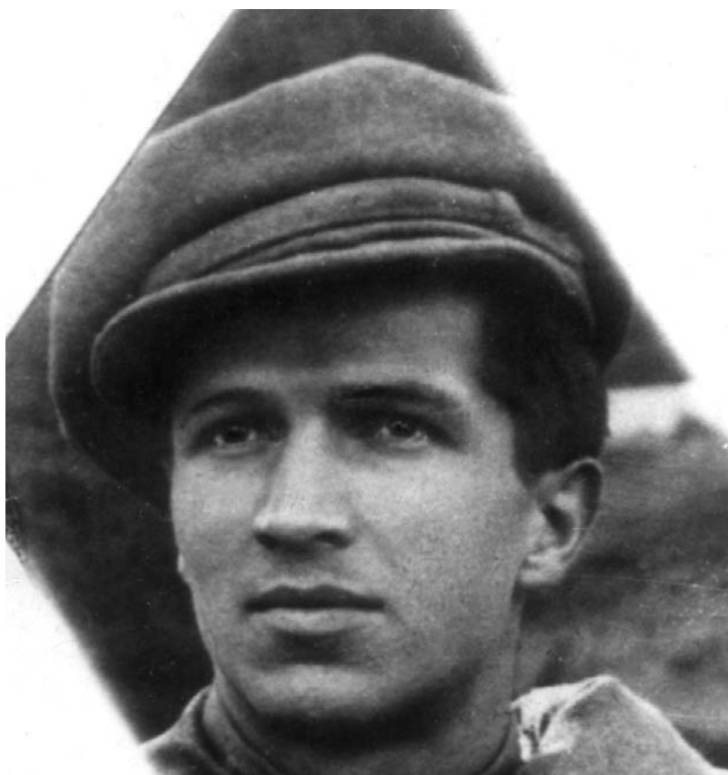
А. Кордюм. 1918 рік.