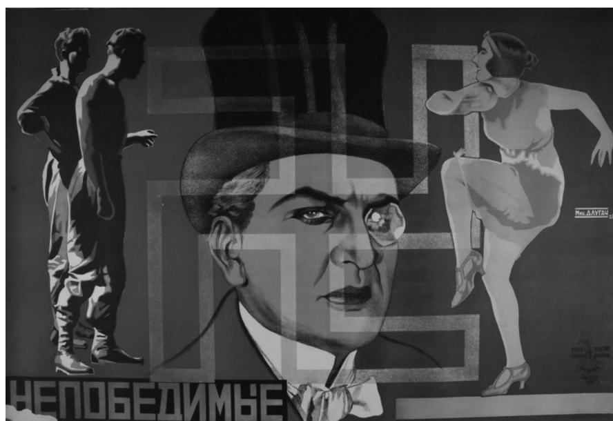
«Непереможні». Кіноплакат. (1927). Художники В. та Г. Стенберги.