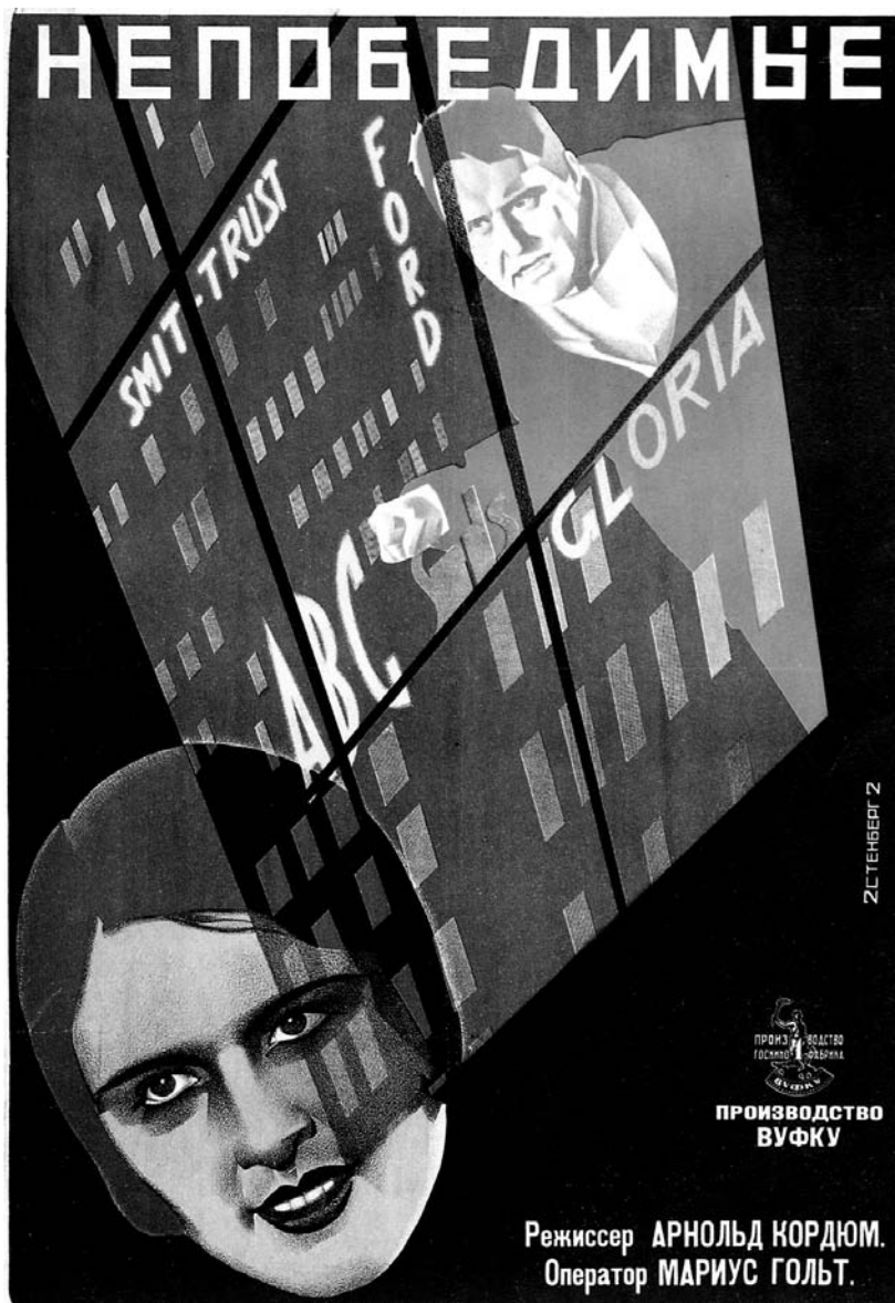
«Непереможні». Кіноплакат. (1927). Художник М. Длугач.