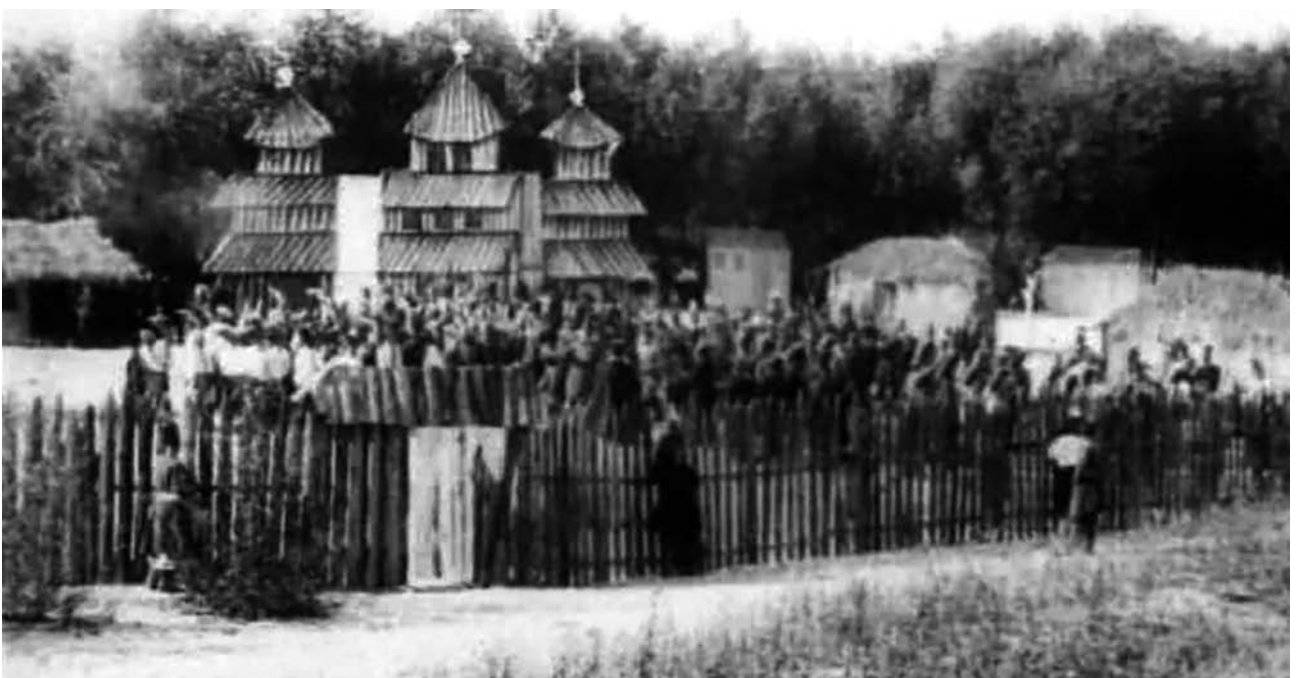
Кадри з фільму «Запорізька Січ».