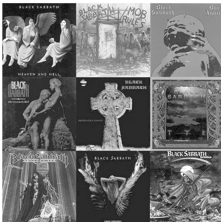
Рис. 3. Обкладинки альбомів зліва направо, зверху донизу: Heaven and Hell (1980); Mob Rules (1981); Born Again (1983); The Eternal Idol (1987); Headless Cross (1989); Tyr (1990); Dehumanizer (1992); Cross Purposes (1994); Forbidden (1995) 21 .