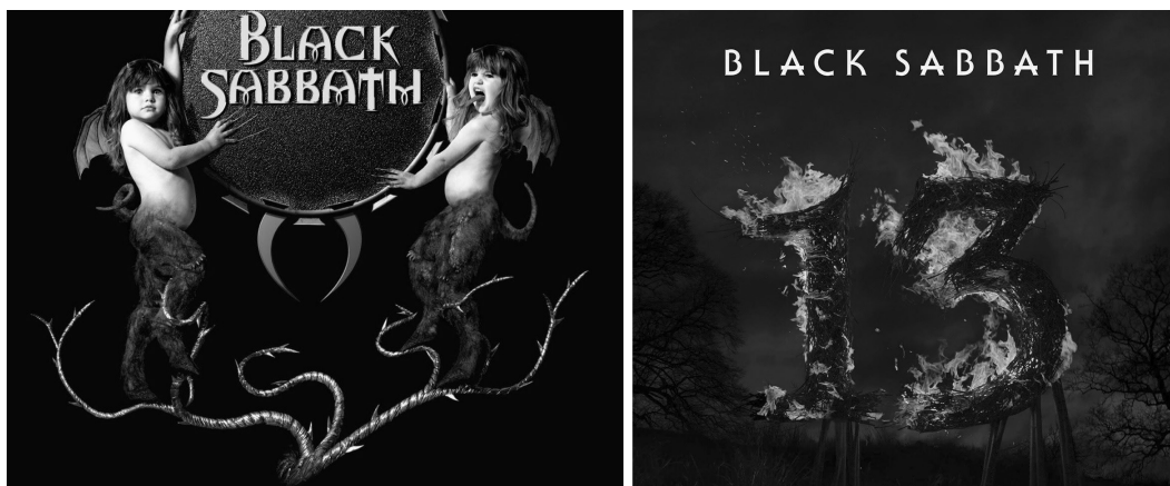
Рис. 2. Обкладинки альбомів зліва на право: Reunion (1997); 13 (2013) 20 .

Беручи до уваги усі альбоми, що виходили під лейблом Black Sabbath, до вищевказаного списку додається наступний перелік, з якого лише обкладинка «Seventh Star» 1986 року не містить інфернальної тематики. Список наводимо в хронологічному порядку: