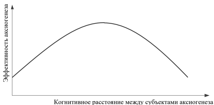
Рис. 3. Зависимость эффективности совместного аксиогенеза от степени когнитивной гетерогенности субъектов сотворчества [8]

Структурное сопряжение рынка и предприятия запускает процесс симбиотического творчества, в рамках которого рынок маркирует ожидаемые свойства, что инициирует на предприятии операции, связанные с их материализацией. Это значит, что объектная ценность приобретает практический смысл, идейное многообразие инициирует функцию упорядочения инновационной деятельности предприятия, ориентируя его на создание консонансной ценности. Достоинством совместного создания ценности является разнообразие идей и опыта (рис. 3), снижающее индивидуальную предрасположенность к искажающему восприятию и расширяющее когнитивную область аксиогенеза, как необходимое условие осуществления тонкой подстройки к параметрам возрастающей сложности рыночных условий.