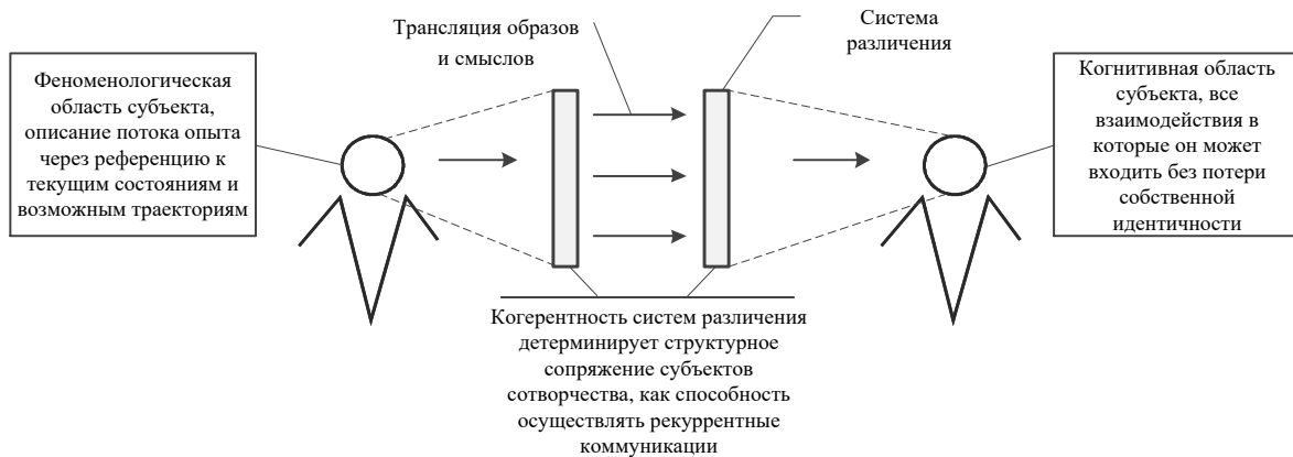
Рис. 2. Схема взаимодействия субъектов сотворчества

Акты мышления продуцируют смысл, создавая его из множества сигналов гомогенной реальности, в которой субъект производит различение и запускает механизм конструирования смыслов. Когерентность различений позволяет сформировать коллаборационное сообщество, которое может быть детерминировано посредством резонанса систем различения, формируя, таким образом, аксиологическую сопряженность субъектов сотворчества (рис. 2). В современных когнитивных подходах, такое взаимодействие описывается, по словам Р. Витакера, как «семантическое сопряжение – процесс, с помощью которого каждый из наблюдаемых взаимодействующих рассчитывает соответствующее состояние на основе информативного входа от другого» [2].