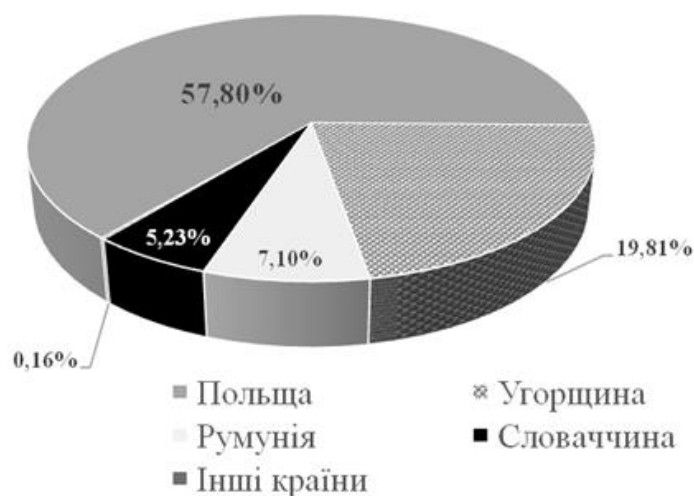
Рис. 2. Структура географічного розподілу туристичних потоків українців до країн ЄС за період функціонування безвізу (11.06.2017 – 11.09.2017) [4]

Ще одним доказом того, що безвізовим режимом скористалися за перший тримісячний період громадяни України, які за будь-яких обставин (навіть без введення безвізу) планували поїздку до ЄС – є невелика кількість відмов у в'їзді до ЄС. У період з 11.06.2017 по 11.09.2017 було відмовлено у в'їзді до країн Євросоюзу всього 61 громадянину України, що становить лише 0,0044% загальної кількості українців, які слідували до ЄС з біометричними паспортами. Основна причина відмов: перевищення терміну перебування на території країни попереднього в'їзду [4].