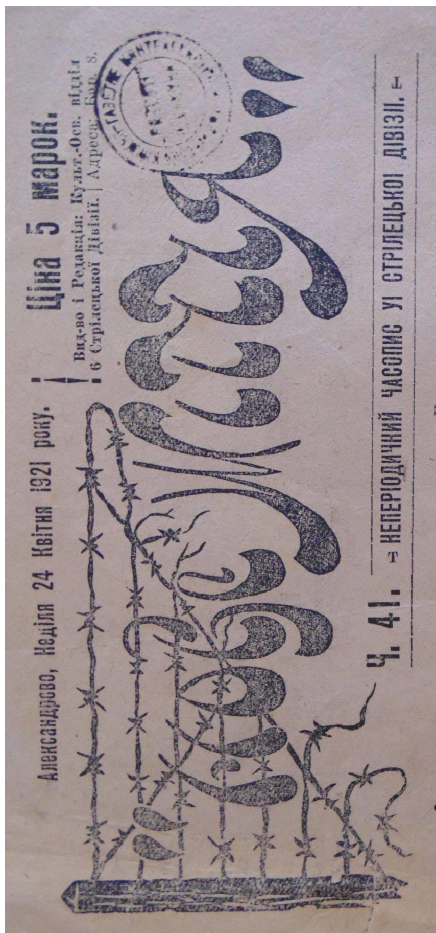
Рис. 3. Верхня частина титульної сторінки таборового часопису «Нове життя», Александрів Куявський, 1921 р.