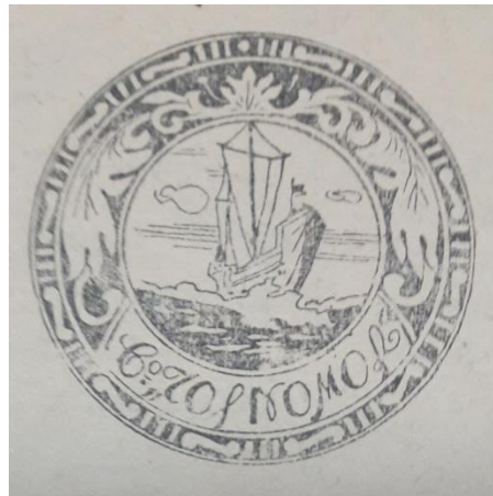
3. Логотип видавництва «Чорномор», яке допомагало грошовими внесками «Товариству допомоги для Української шкільної молоді в таборах інтернованих в Польщі» (був уміщений на бюлетенях «Товариства допомоги для Української шкільної молоді в таборах інтернованих в Польщі»).