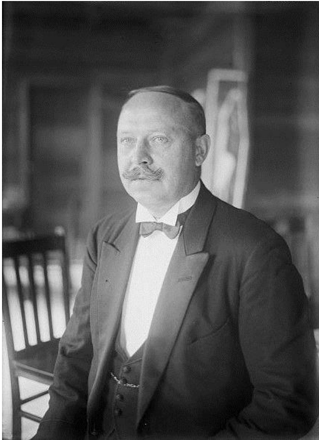
6. Керівник і диригент «Української Республіканської Капели» Олександр Кошиць – один з жертводавців «Товариства допомоги для Української шкільної молоді в таборах інтернованих в Польщі» (1920-ті рр.)