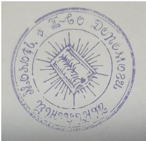
2. Печатка «Товариства допомоги для Української шкільної молоді в таборах інтернованих в Польщі» (ЦДАВО України, ф. 2467, оп. 1, спр. 3).