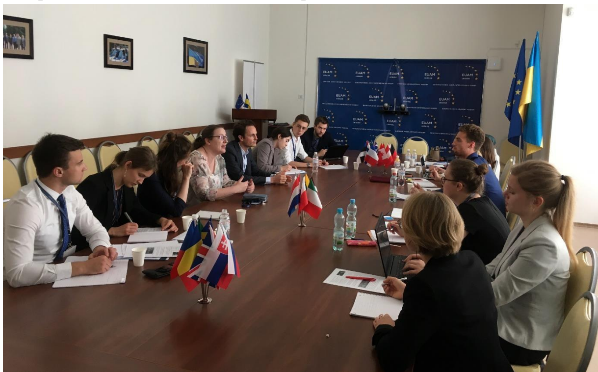
Інтерв'ю з Фредеріком Веслау, заступником голови Консультативної місії ЄС (EUAM) в Україні

«людського» аспекту конфлікту на сході і щоденних випробувань, з якими стикаються українці, що проживають в безпосередній близькості до зони бойових дій. Переважна більшість тих, з ким студенти провели інтерв'ю, були дуже відкритими до запитань і поділилися цікавими свідченнями про політичну систему в Україні. Вони ясно дали зрозуміти: конфлікт на Донбасі значно більшою мірою політичним, аніж етнічним протистоянням.