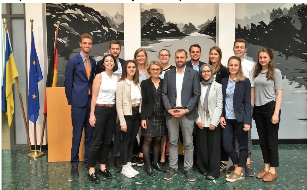
Підпис під фото: Учасники проекту в посольстві Німеччині в Україні, Київ