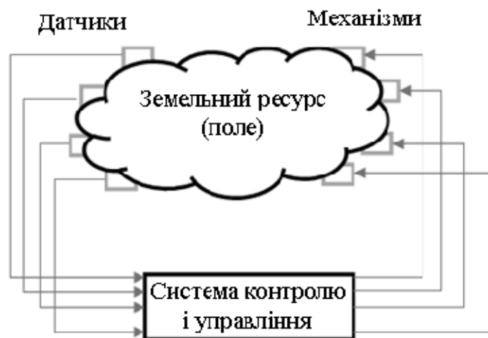
Рисунок 3 – Взаємодія інформаційної технології з полем

Використовуючи інформаційні технології можна виділити дві стратегії для оптимізації витрат [4]: