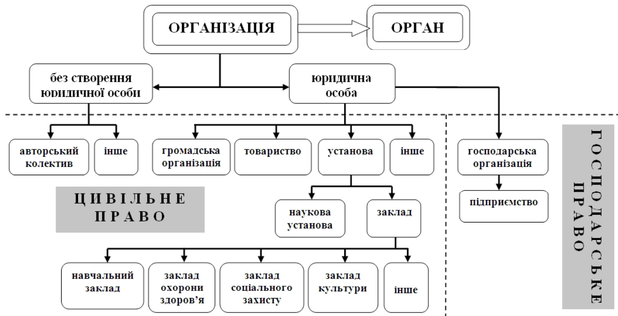
Рис. 1. Схема співвідношення понять заклад культури , підприємство , організація , орган , установа [17, 33-36]

Єдиним осередком реалізації культури у сільській місцевості є заклади культури, які відіграють важливу роль у збереженні національної самобутності, підвищенні культурного потенціалу суспільства. Згідно з Законом України «Про культуру», заклад культури – юридична особа, основою діяльності якої є діяльність у сфері культури, або структурний підрозділ юридичної особи, функції якого полягають у провадженні діяльності у сфері культури [13, 1]. Дане визначення слід вважати дискусійним, оскільки з поняттям заклад культури в законі використовуються й інші поняття, такі як організація , підприємство , орган , установа . На рис. 1 зображено їхню взаємозалежність та місце закладу культури.