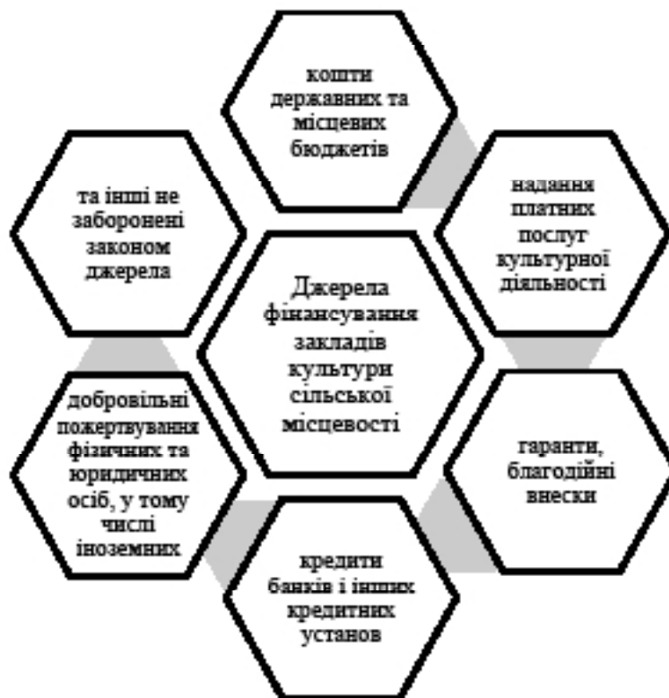
Рис. 2. Джерела фінансування закладів культури у сільській місцевості

Поліпшити стан матеріально-технічної бази сфери культури за рахунок фінансового забезпечення з боку лише держави практично неможливо. Отже, необхідно шукати додаткові ресурси. А це потребує розвитку маркетингу, менеджменту, розробки нових систем управління, направлених на пошук додаткових фінансових ресурсів. Саме такий підхід дозволить забезпечити більш активну спонсорську допомогу.