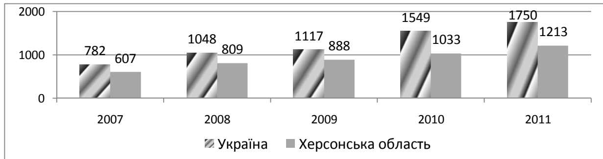
Рис. 2. Середньомісячна заробітна плата найманих працівників на малих підприємствах Херсонської області, грн [4, 5]

У 2010 році середньомісячна заробітна плата одного найманого працівника на малому підприємстві склала 1033 грн і проти попереднього року зросла на 16,3 %; у 2011 році середньомісячна заробітна плата становила 1213 грн, що більше минулорічного показника на 17,4 %. Незважаючи на збільшення рівня оплати праці найманих працівників на малих підприємствах області, цей показник є нижчим від середнього рівня по Україні загалом: у 2010–2011 роках – на 44,3–50,0 % (рис. 2).