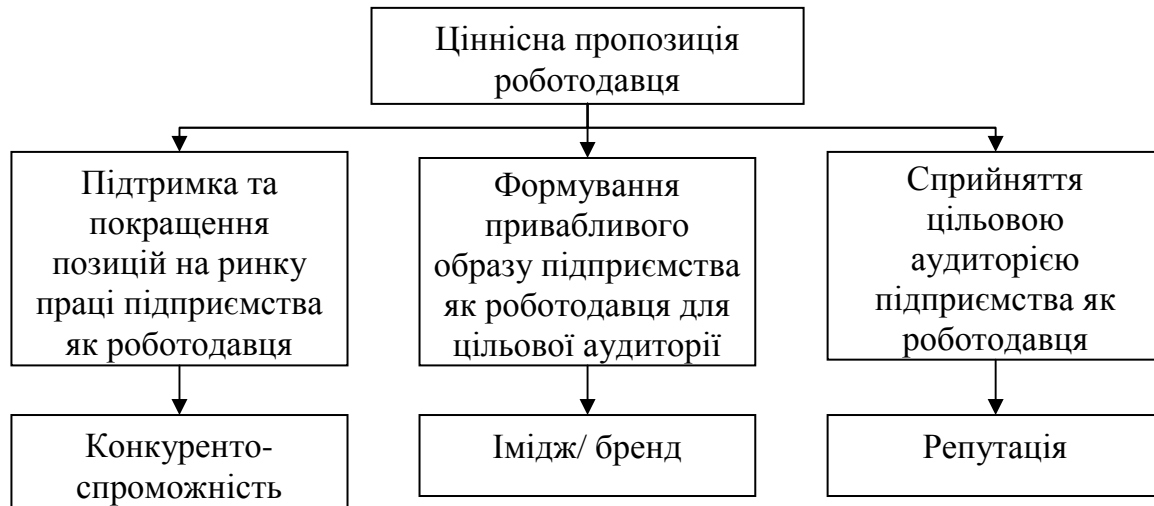
Рис. 1. Терміносистема привабливості підприємства як роботодавця

Вважається, що будь-який працівник на підприємстві наділений такими якостями, що може в будь-який час витримати конкурс на іншу вакансію в іншій організації та перейти до нового роботодавця. Саме тому привабливість роботодавця має будуватись враховуючи як потенційний, так і наявний персонал (цільову аудиторію).