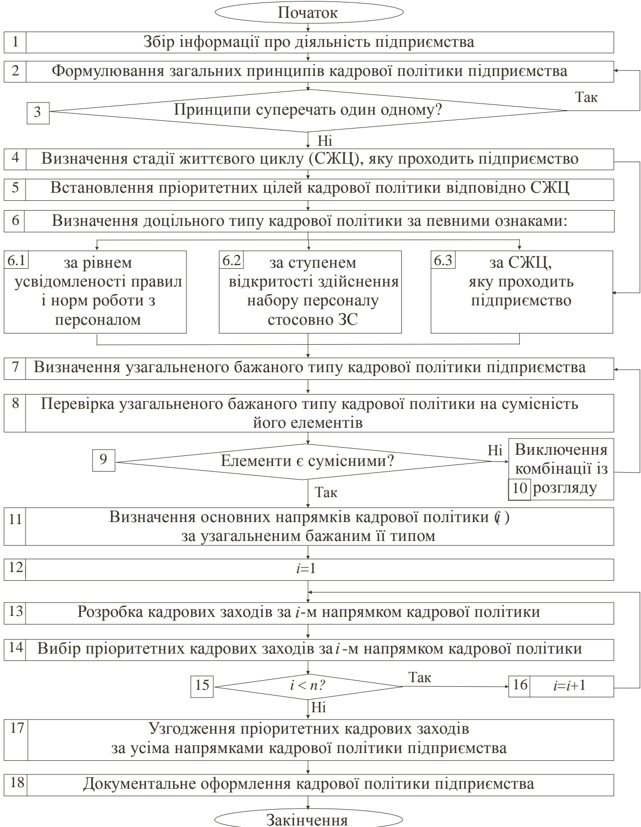
Рис. 2. Блок-схема процесу розробки кадрової політики підприємства