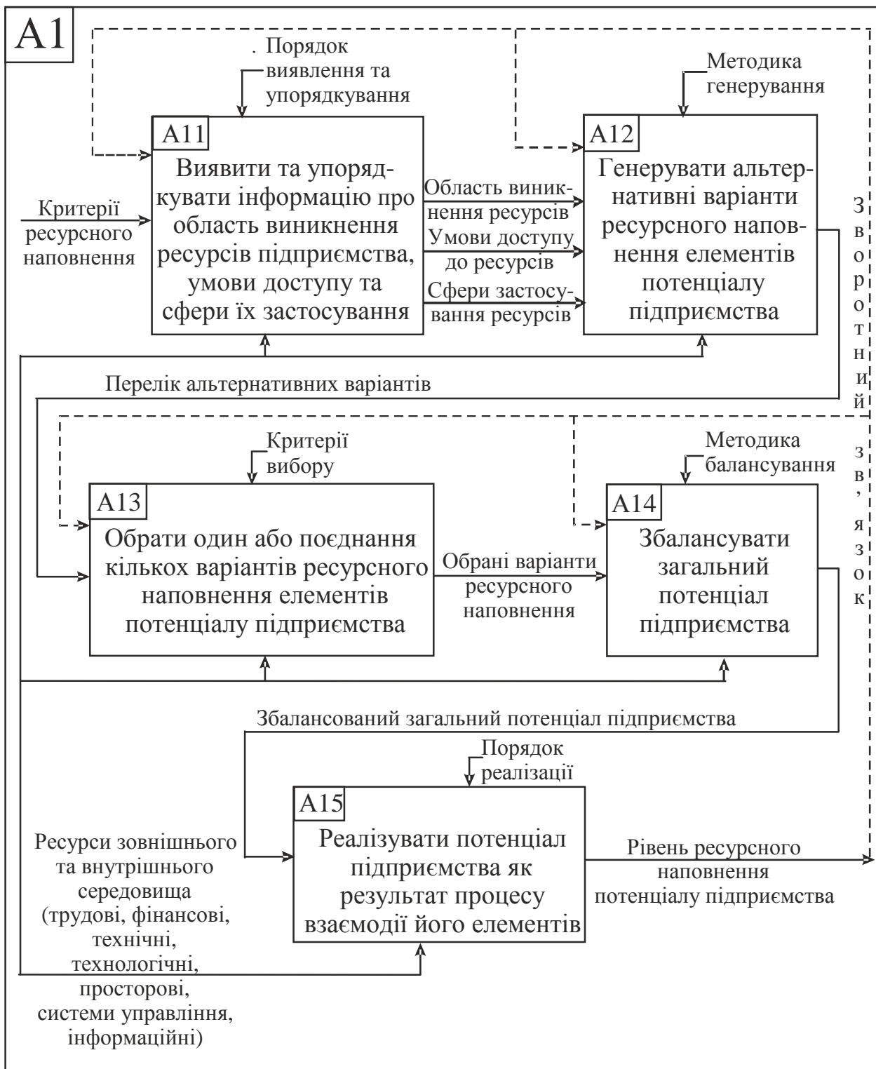
Рис. 3. Декомпозиційна діаграма процесу формування (створення та реалізації) потенціалу підприємства

Внутрішня характеристика потенціалу підприємства відображається ресурсами його внутрішнього середовища. Водночас слід враховувати, що підприємство функціонує у постійно змінюваному,