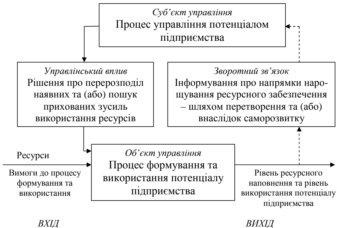
Рис. 1. Загальна схема процесу управління потенціалом підприємства згідно системно-кібернетичного підходу

Далі необхідно визначити те, на що спрямовано управлінський вплив, тобто об'єкт управління.