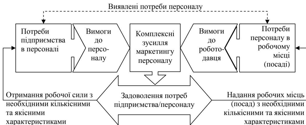
Рис. 3. Концепція маркетингу персоналу (з позиції підприємства)

У цьому випадку логічно стверджувати, що потреба підприємства в персоналі є першочерговою, оскільки за рахунок неї на підприємстві ініціюють побудову, впровадження та реалізацію даного виду управлінської діяльності всередині підприємства.