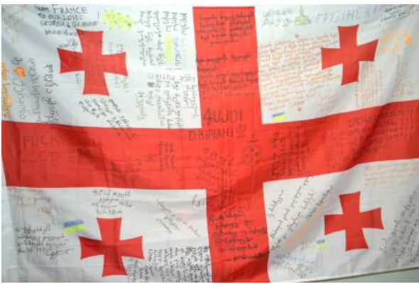
Рис. 2. Прапор Грузії з автографами бійців «Грузинського легіону» (із колекції НМІУ)