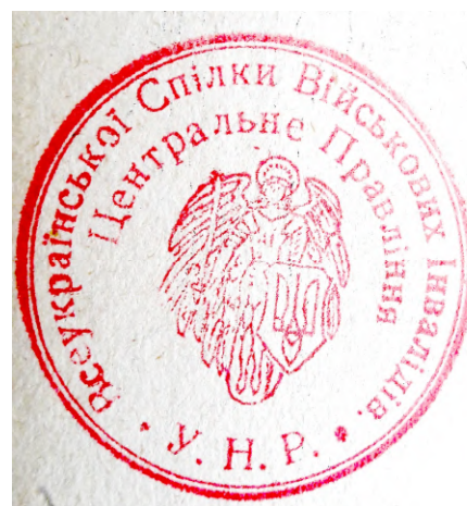
Іл. 1. Відтиск печатки Всеукраїнської спілки військових інвалідів УНР, Тарнів (Польща), 1922 р. (Центральний державний архів вищих органів влади та правління України, ф.1075, оп.2, спр.822)