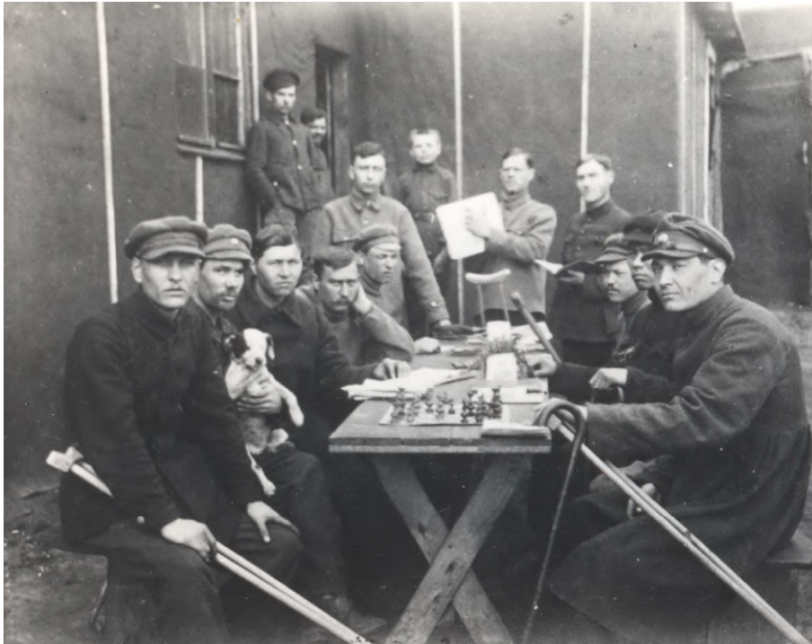
Іл. 3. Група інвалідів Армії УНР, інтернованих у таборі Каліш, Польща, 1921 р.