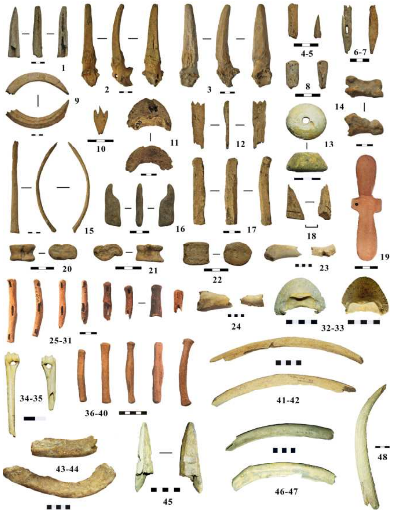
Рис. 2. Костяные и каменные изделия из помещения № 21 и внутреннего рва городища Дикий Сад.

1, 4-5, 8, 10, 18, 23-24 – обработанные и резные кости; 2-3 – рога козы, подработанные под заготовку стержневидных псалев; 6-7, 17, 25-31, 36-40 – стержневидные псалы и их заготовки; 9 – обработанный клык; 11, 32-33 – лоцила из копыт лошади; 12 – трехзубчатый костяной штамп; 13 – пряслице; 14, 20-21 – фаланга и таранные кости; 15 – рог со следами обработки (свайка?); 16 – каменное орудие для лощения; 19 – пластина для ременной узды; 22 – катушка; 34-35 – проколки; 41-42 – струги; 43-44, 46-47 – тупики; 45 – наконечник гарпуна; 48 – цельный рог косули.