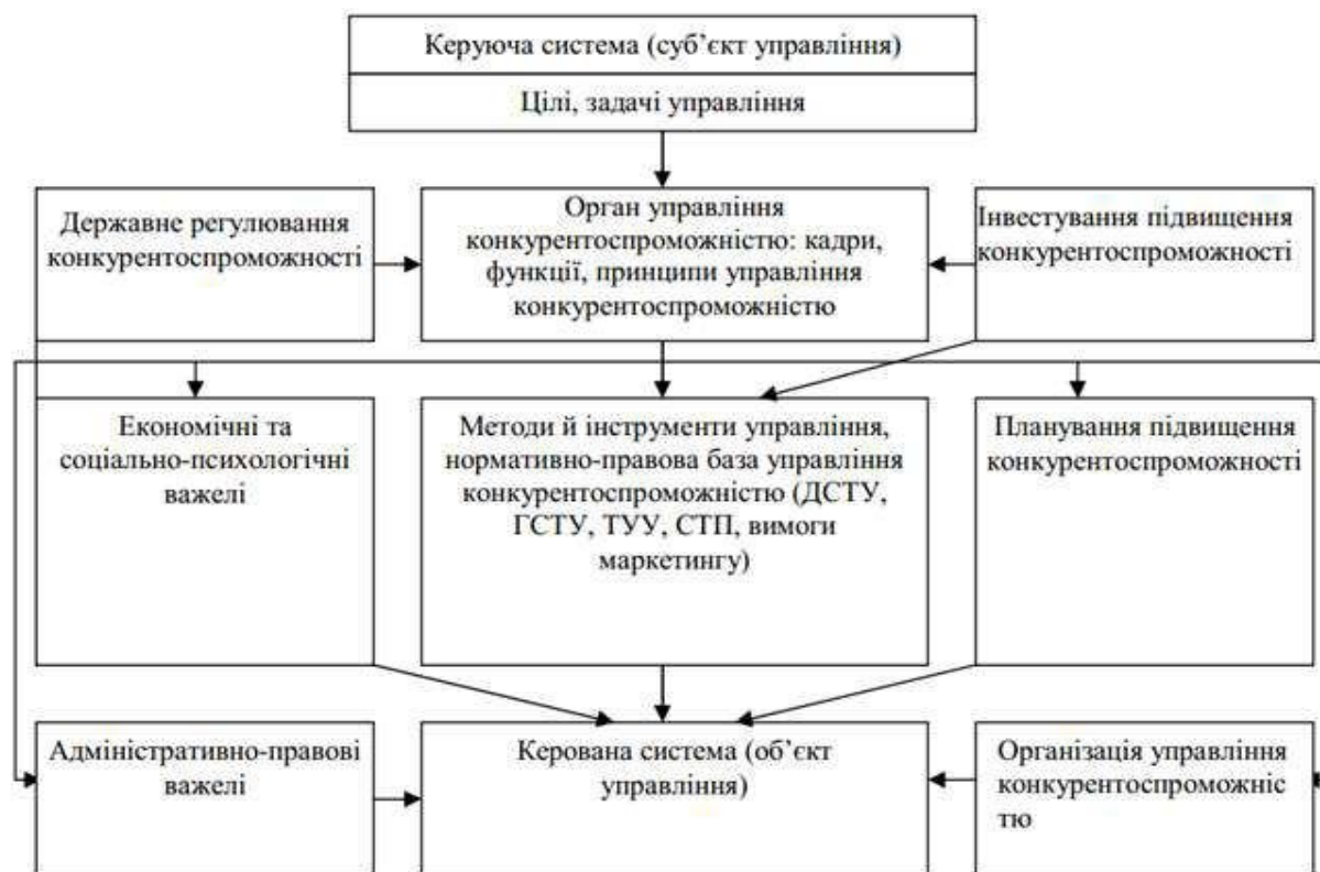
Рис. 1. Схема організаційно-економічного механізму управління конкурентоспроможністю харчового підприємства