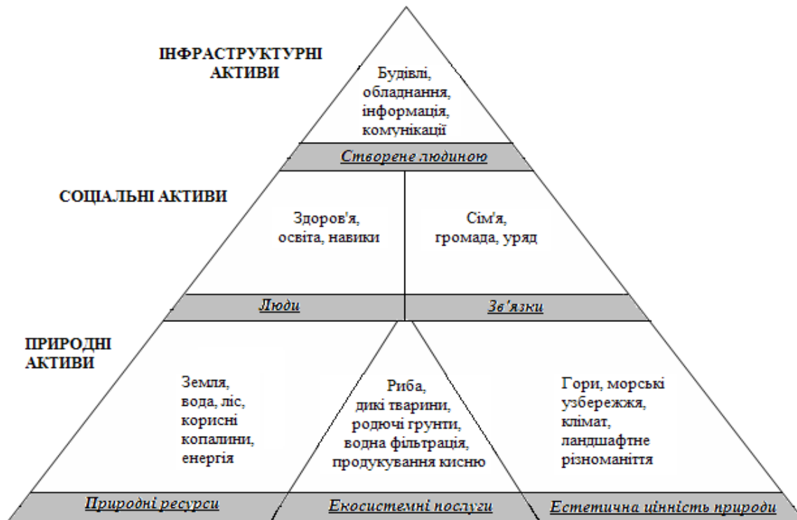
Рис. 2. Піраміда активів територій за видами

бажання, очікування) [7, с. 90–95]. Одночасно керівники громади формують базу даних з інформацією про належні їй природні ресурси, економічні, інфраструктурні, культурно-історичні активи (рис. 2). На наступному етапі оцінюються фінансове забезпечення громади, у тому числі спроможність та готовність її членів спрямовувати власні кошти на спільний розвиток. Подальші дії включають узагальнення інформації в єдину інформаційну систему (за допомогою типового програмного забезпечення) та, як наслідок, визначення сильних сторін і можливостей розвитку громади.