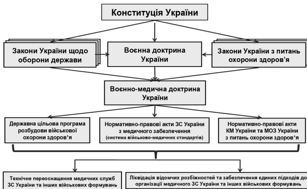
Рис. 1. Структура нормативно-правової бази медичного забезпечення ЗС України та інших військових формувань

Окремо слід зазначити відсутність у державі основоположного документа щодо завчасної підготовки системи цивільної та військової охорони здоров'я до роботи в особливий період та організації медичного забезпечення військовослужбовців у воєнний час – Воєнно-медичної доктрини України, роль і місце якої у системі законодавчих і нормативно-правових актів держави показано на рис. 1.