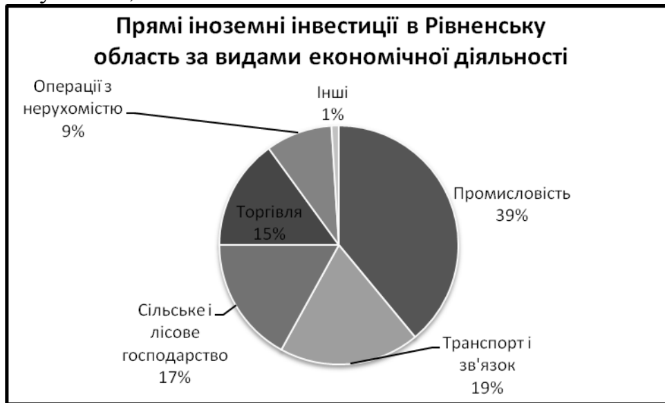
Рис. 2 Прямі іноземні інвестиції в Рівненську область за видами економічної діяльності. (за даними [2])

Щодо структури зовнішньої торгівлі послугами, то вона головним чином визначається наданням транспортних послуг – 64% в експорті (через область проходить Пан'європейський транспортний коридор Балтійське море – Чорне море та Пан'європейський транспортний коридор № 3 (Берлін-Вроцлав-Краків-Львів-Київ)). Найбільше цих послуг отримує Російська Федерація, Австрія, Італія та Німеччина. В імпорті визначальними є різні ділові, професійні та технічні послуги – 51,7%.