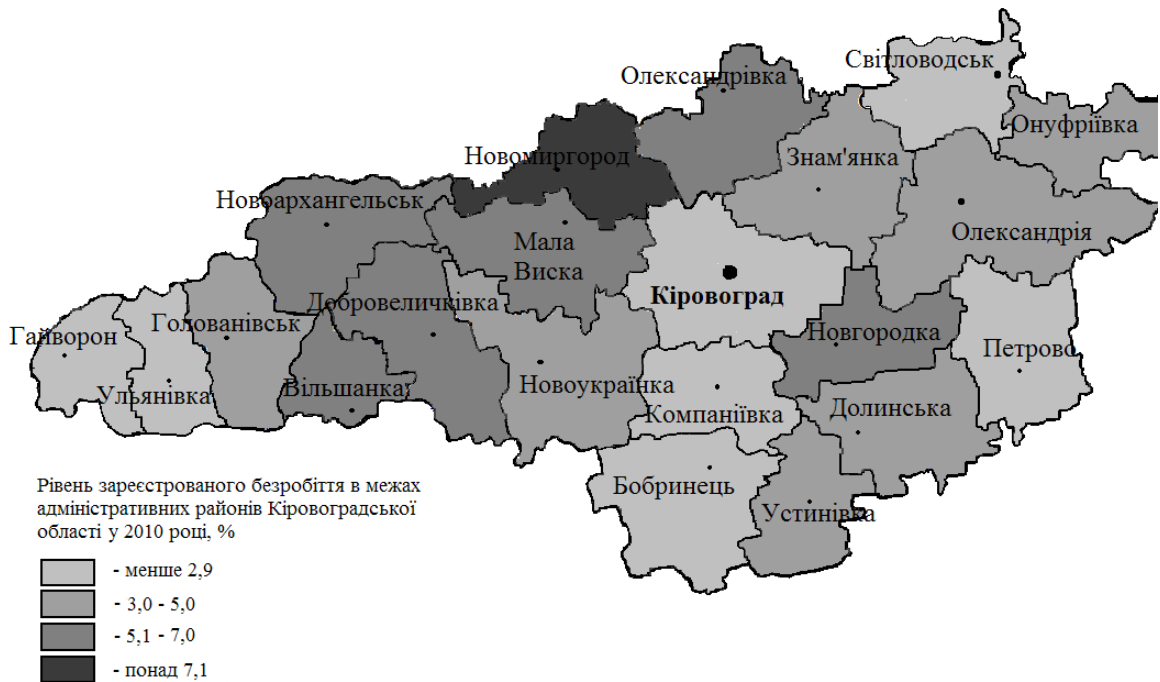
Рис. 2. Рівень зареєстрованого безробіття в Кіровоградській області у 2010 році

спостерігається значна диференціація зазначеного показника від 7 осіб у Кіровограді до 97 осіб у Новоархангельському районі. Так, найбільше навантаження на одне вільне робоче місце було у Вільшанському, Добровеличківському, Маловисківському, Новгородківському та Новоукраїнському районах, а найменше – у Кіровоградському та Олександрійському. Такі райони, як Гайворонський, Знам'янський та Олександрівський мали навантаження на одне вільне робоче місце від 52 до 74 осіб, а Бобринецький, Голованівський та Долинський – від 29 до 51.