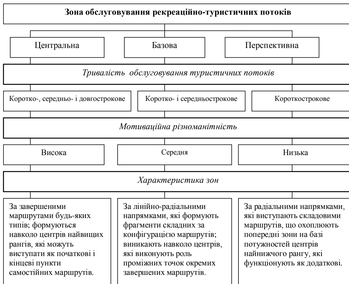
Рис. 1. Функціональні зони в організації комплексного обслуговування туристичних потоків

концентрації ресурсів, що визначають спрямованість туристичних потоків і зосередження підприємств, які їх обслуговують. Таким чином, можна виділити зони обслуговування рекреаційно-туристичних потоків (рис 1).