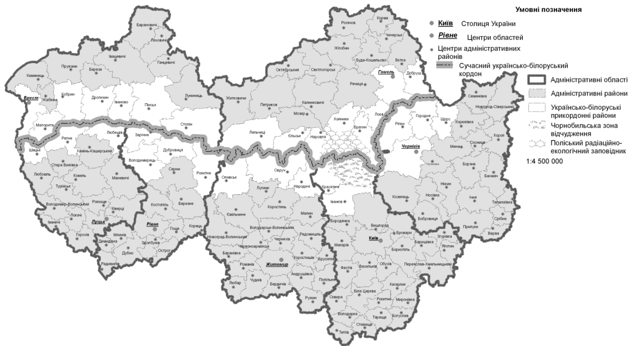
Рис. 3. Українсько-білоруське прикордоння у XXI ст.