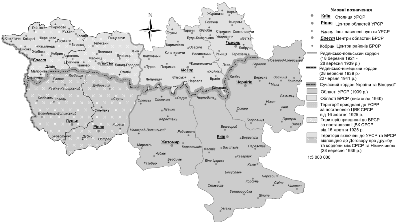
Рис. 2. Українсько-білоруське прикордоння, 1939 рік

Остаточо українсько-білоруський кордон був сформований з приєднанням західних територій на основі поділу Польщі між СРСР та Німеччиною згідно договору про розподіл сфер впливу між Німеччиною та СРСР у вересні 1939 року. Питання проходження кордону між союзними республіками на приєднаних територіях виступило об'єктом територіальних суперечок між партійними керівниками БРСР (першим секретарем ЦК КП(б)Б – П. К. Пономаренком) та УРСР (першим секретарем ЦК КП(б)У – М. С. Хрущовим). За варіантом М. С. Хрущова, кордон між західними областями мусив був проходити значно північніше міст Брест, Пружани, Столін, Лунінець та Кобрин, а також більша частина Біловежської Пущі відходили б Україні. Зі своєї сторони білоруська сторона, яку представляв П. К. Пономаренко пересувала кордон південніше Пінська, Лунінця, Кобрину, Барановичів та Бресту. Остаточну ясність у питання вніс голова СРСР Й. В. Сталін, який вислухавши обидві сторони, затвердив білоруський варіант, внівши корективи та зробивши незначні територіальні уступки українській стороні [8]. Указом президії Верховної ради УРСР від 27.11.1939 року був затверджений українсько-білоруський кордон та створені нові адміністративні одиниці на приєднаних територіях (див. рис. 2) [14].