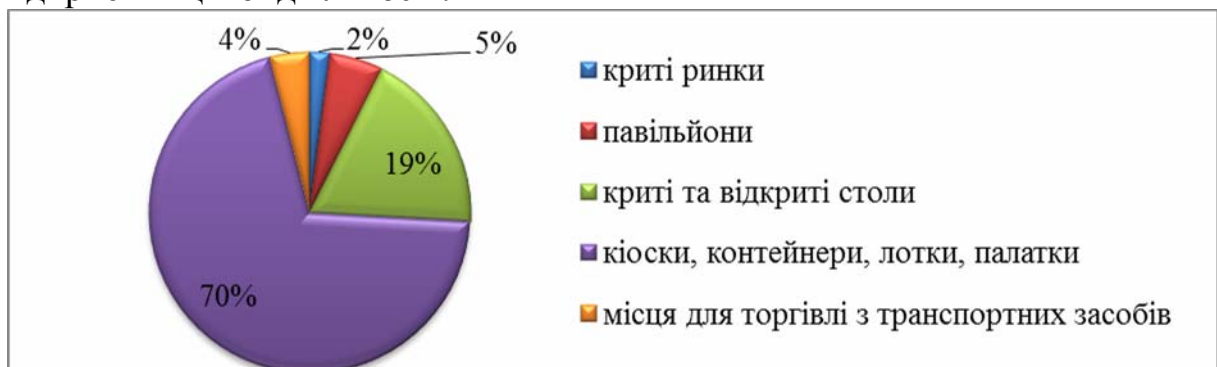
Рис. 1 – Структура торгових місць на ринках з продажу споживчих товарів у 2010 році

Розвиток мережі продовольчих, непродовольчих та змішаних ринків зумовлює забезпечення соціальної підтримки значної частини населення, розширення сфер діяльності та збільшення торгового обороту суб'єктів підприємницької діяльності.