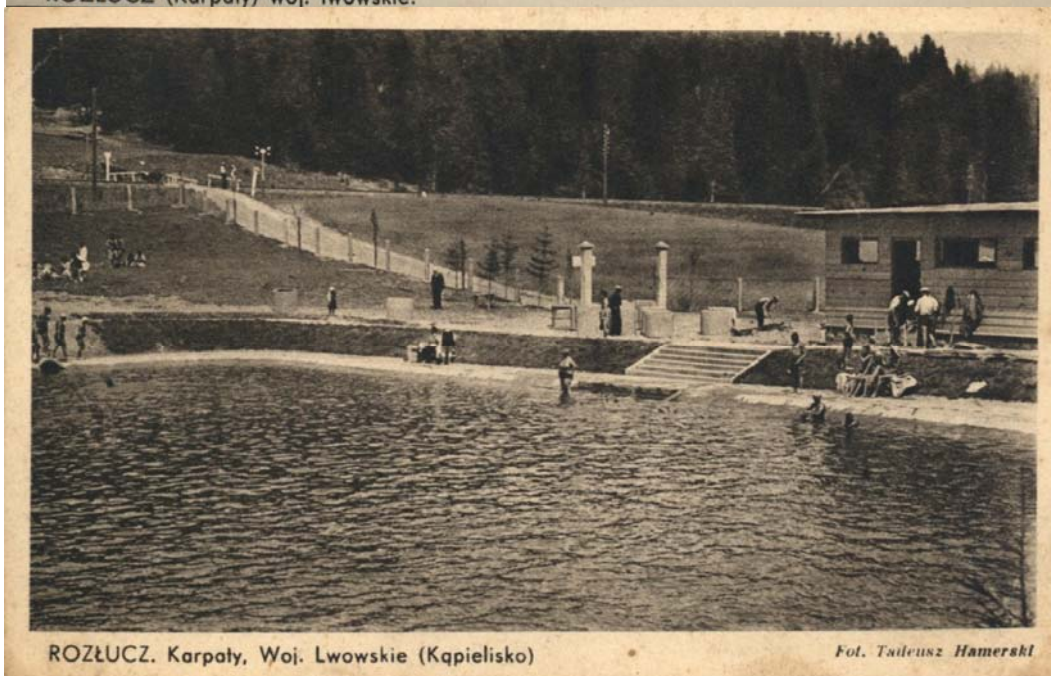
ROZŁUCZ. Karpaty, Woj. Lwowskie (Kąpielisko)