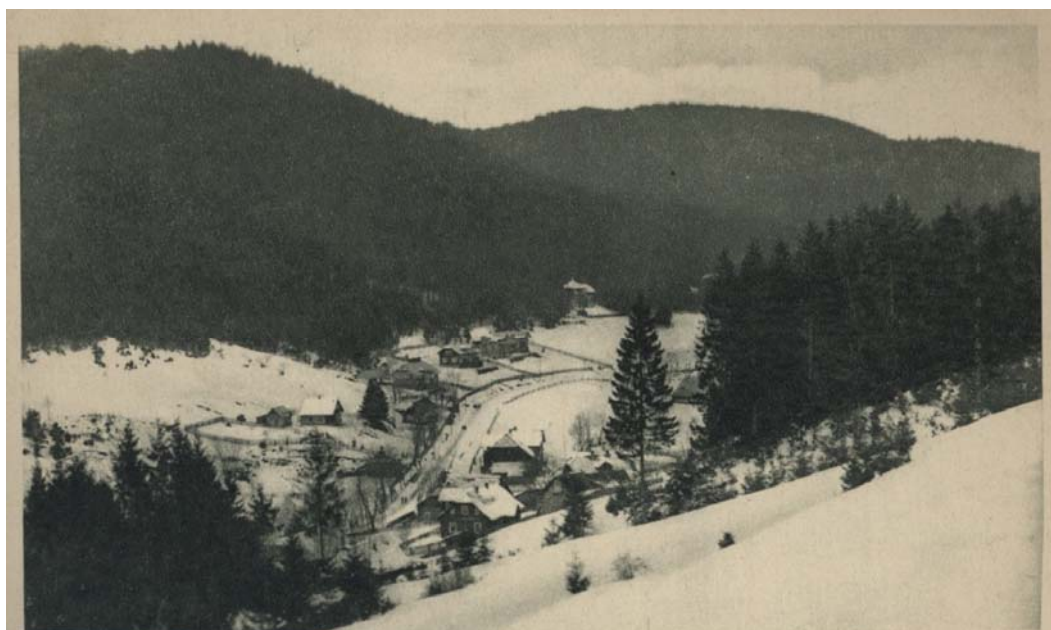
ROZŁUCZ (Karpaty) woj. lwowskie.