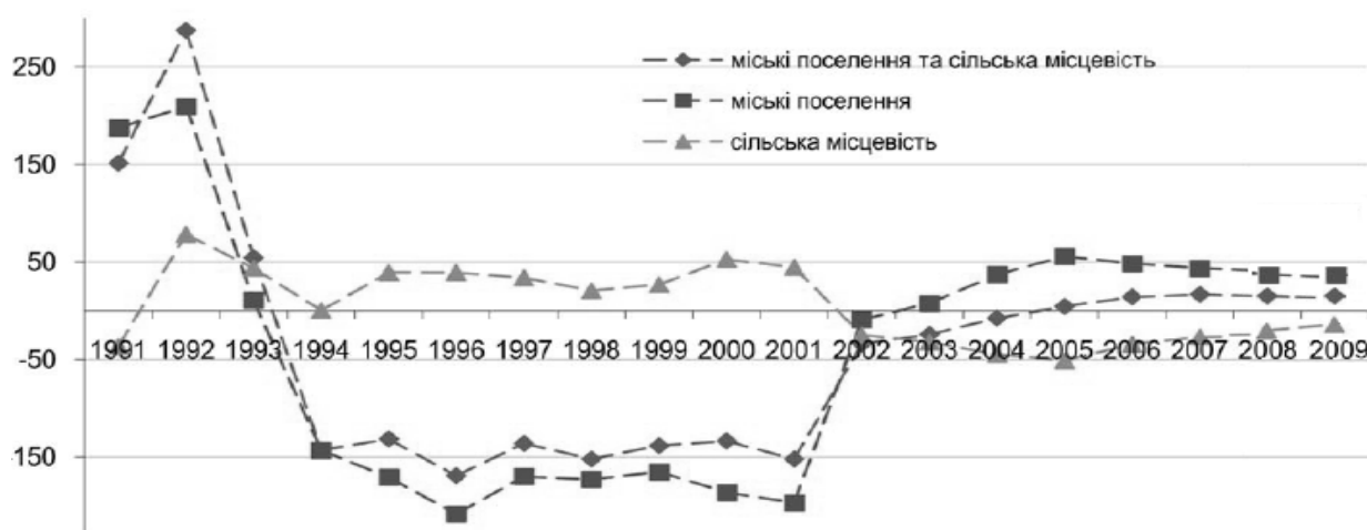
Рис. 1 – Динаміка сальдо міграцій населення в Україні за типом поселення [2].

Відображення сальдо міграцій населення у розрізі типів поселень, дає уявлення про зміни механічного руху населення у містах і селах (рис. 1).