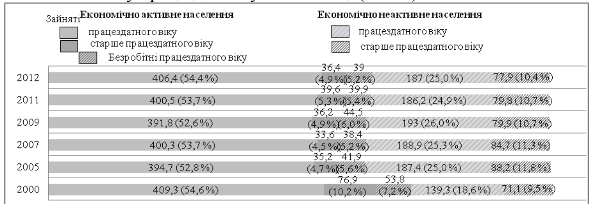
Рис. 1 – Динаміка населення у Волинській області за економічною активністю, тис. осіб, % (Складено за матеріалами [10])

Важливим показником ринку праці є економічна активність населення, яка суттєво впливає на рівень економічного розвитку. В області в період з 2000 по 2012 рр., показники кількості економічно активного населення є вищими від показників економічно неактивного населення. У період з 2000 по 2012 рр. показники економічно активного населення коливались від 72 % у 2000 році до 64,6 % у 2012 році, а частка економічно неактивного населення відповідно від 28 % у 2000 році до 35,4 % у 2012 році. Така негативна тенденція відповідає загальній картині ринку праці області, підтвердженням чому є також тенденція до росту частки населення у віці старшому за працездатний і відповідно зменшення частки економічно активного населення у працездатному віці (Рис. 1).