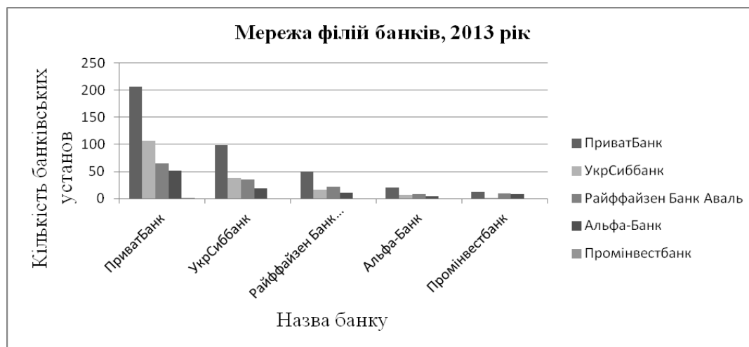
Рис. 1. Порівняльна мережа банківських установ, 2013 рік 2