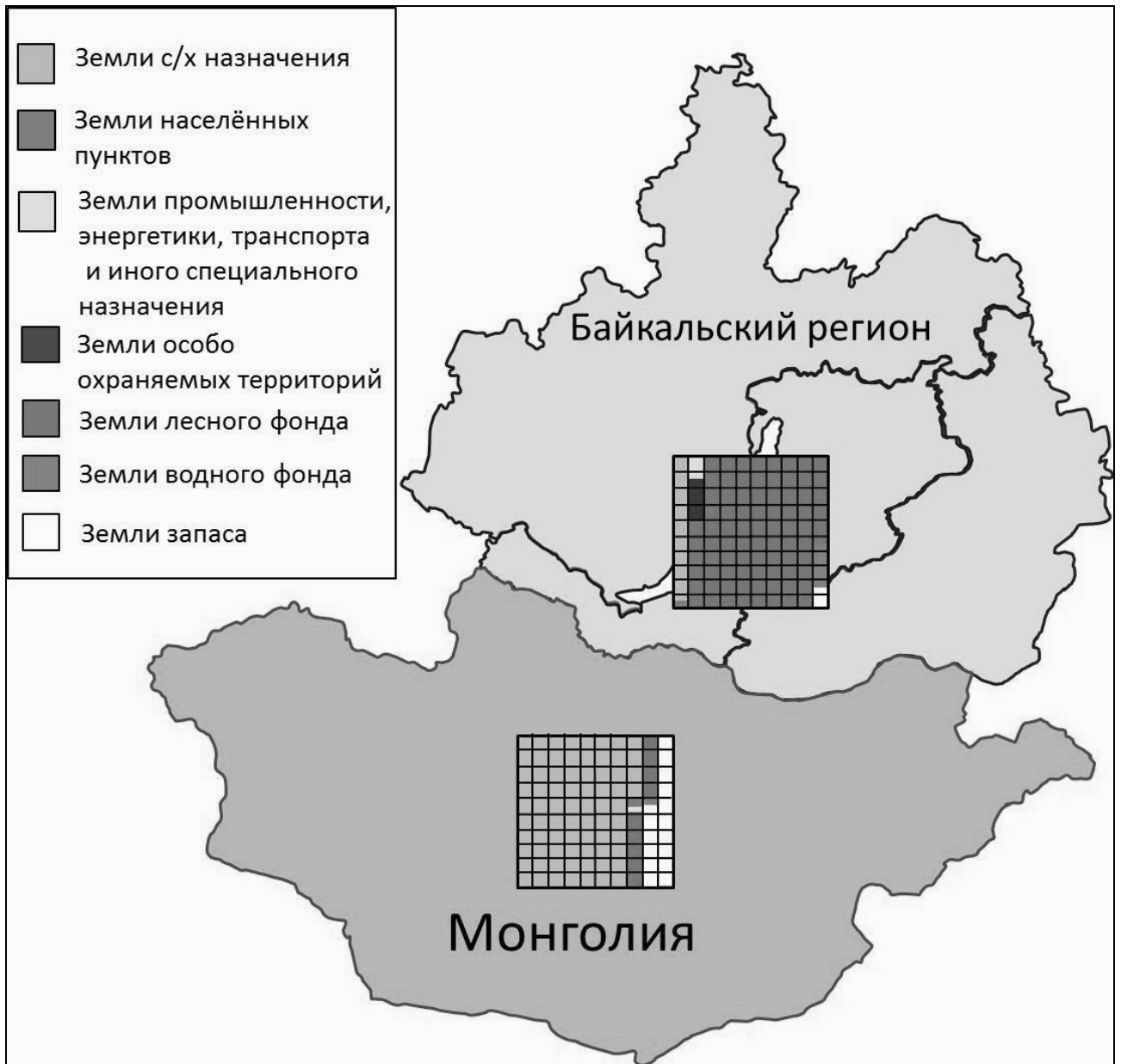
Рис. 2. Земельный фонд Монголии и Байкальского региона

прав собственности на землю между федеральным центром, регионами и муниципальными образованиями.