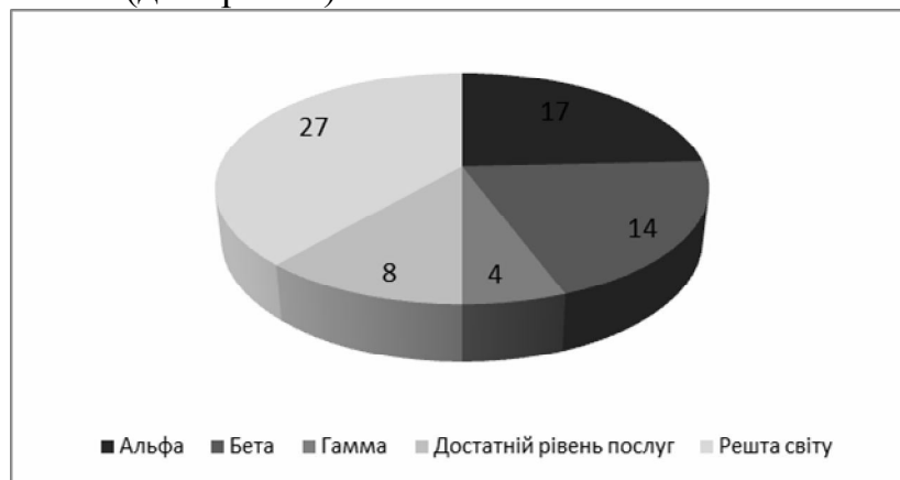
Рис. 2. Кількість актів міжнародного тероризму із числом жертв більше 100 осіб у 1970-2013 рр. – складено на основі [10] та [11]

Якщо брати до уваги тільки найбільші теракти (із кількістю жертв більше 100 осіб), то їх частка у світових містах (усіх категорій) за період з 1970 по 2013 рік складає близько чверті (135 із 510 терактів). При цьому якщо брати до уваги тільки акти міжнародного тероризму, то саме у світових містах сталося більше 60% таких інцидентів (43 з 70): 1 у 1970-х, 10 у 1980-х, 13 у 1990-х, 15 у 2000-х і 4 за період 2010-2013 рр. [10] [11]. Таким чином, їхня кількість постійно зростала. При цьому їхня кількість тим вища чим вищий рівень міста (див. рис. 2).