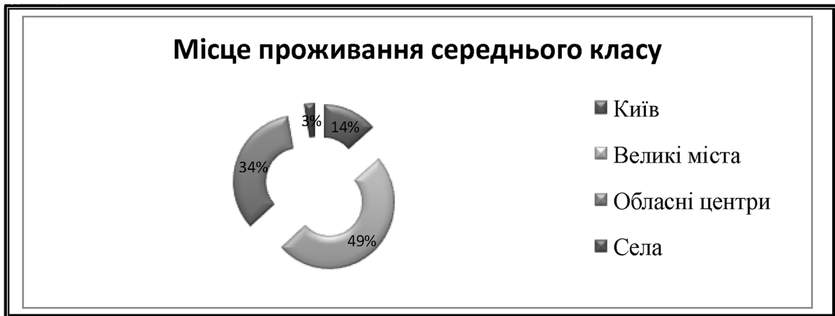
Рис. 1. Розподіл населення України, за місцем проживання середнього класу, 2013 р. (%)