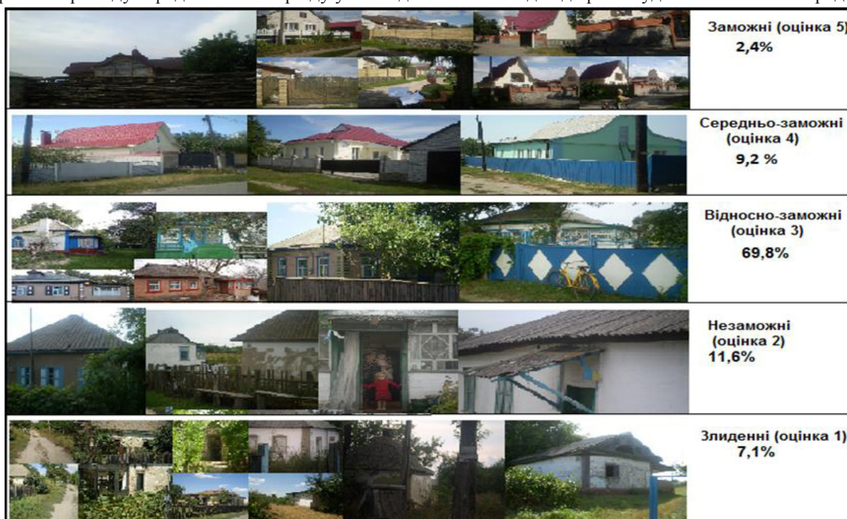
Рис.1. Класифікація будинків за станом бідності / заможності

2. Домогосподарства, які значно розвинулись після отримання Україною незалежності. До 1990 рр. вони були на рівні з домогосподарствами першої групи, але після розпаду СРСР і переходу на ринкові засади господарювання їхніми власниками, загальний вигляд подвір'їв і будинків змінився і продовжує