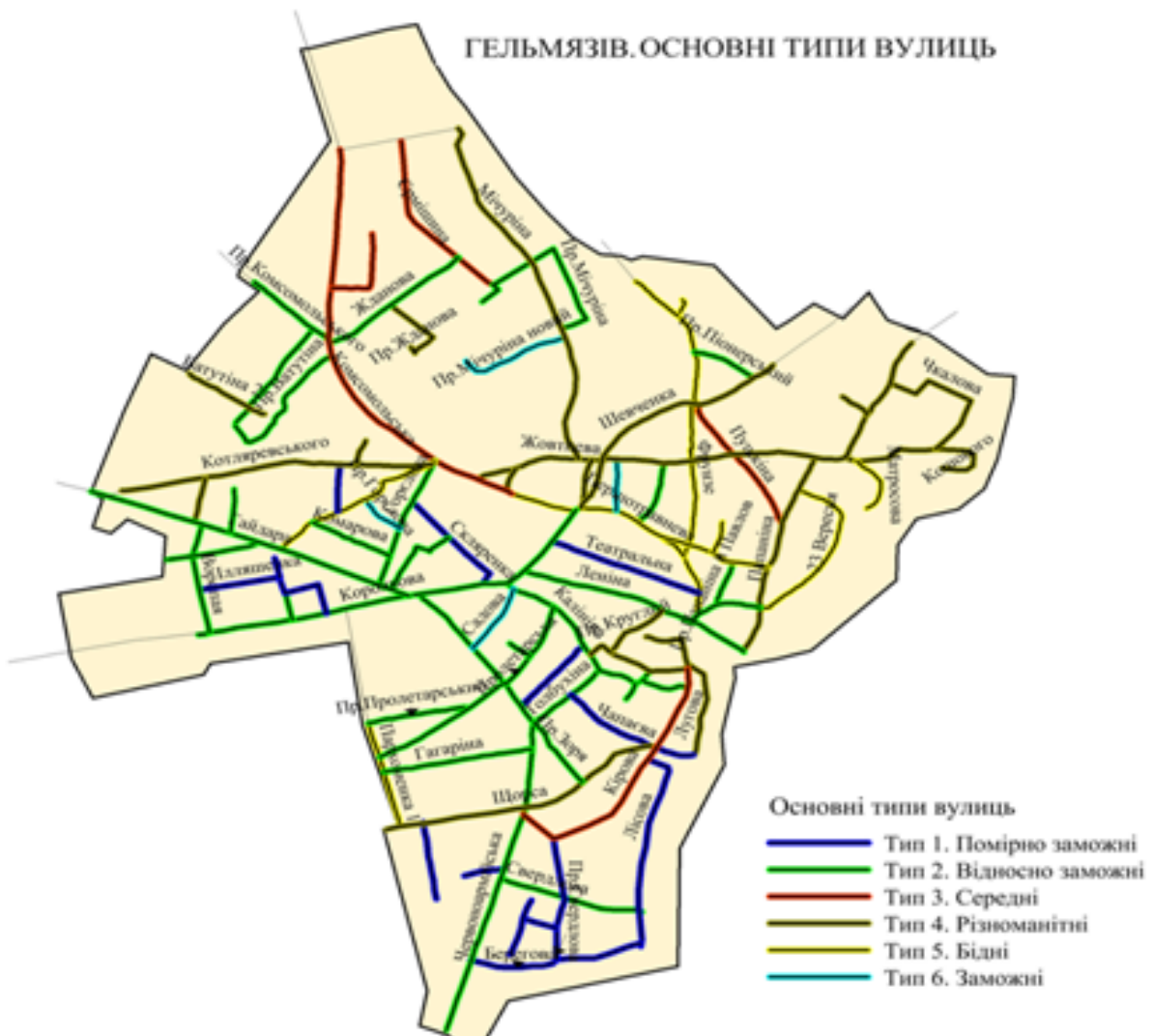
Рис.3. Основні типи вулиць у селі Гельмязів