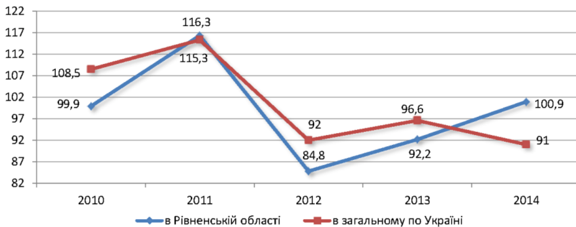
Рис.1. Індеси виробництва іншої неметалевої мінеральної продукції в Рівненській області та в загальному по Україні у 2010-2014 роках, %, (побудовано автором за [2])