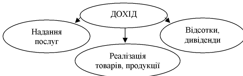
Рисунок 2 – Класифікація доходу з метою визнання та визначення його суми

З метою визнання доходу та визначення його суми дохід поділяють на: дохід від реалізації товарів, продукції, інших активів, придбаних з метою перепродажу (крім інвестицій у цінні папери); дохід, що отримано від надання послуг; дохід, що отримано від використання активів підприємства іншими фізичними та юридичними особами, результатом яких є отримання процентів, дивідендів (рис. 2).