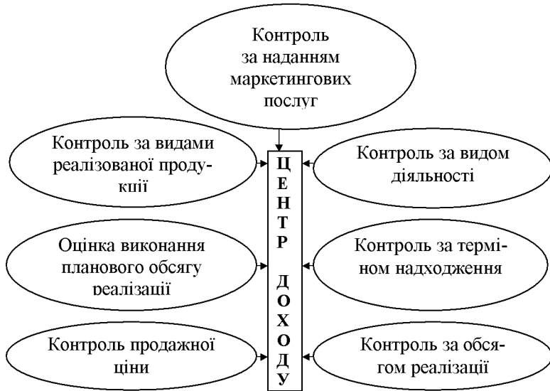
Рисунок 4 – Класифікація доходів центру відповідальності на підприємствах ресторанного господарства

Надана класифікація вивчає дохід у розрізі центру відповідальності. На нашу думку, для управлінських потреб центру відповідальності інформація про дохід потрібна в саме такому вигляді, але, у разі необхідності класифікація може бути змінена відповідно до нових вимог.