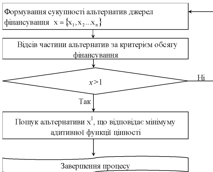
Рисунок 3 – Алгоритм проведення оптимізації джерел фінансування за графічним методом

Алгоритм здійснення оптимізації джерел фінансування за запропонованим методом подано на рис. 3.