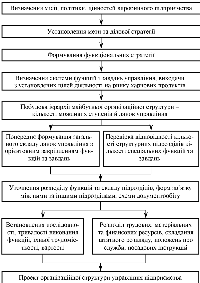
Рисунок 1 – Загальна схема формування організаційної структури управління підприємства