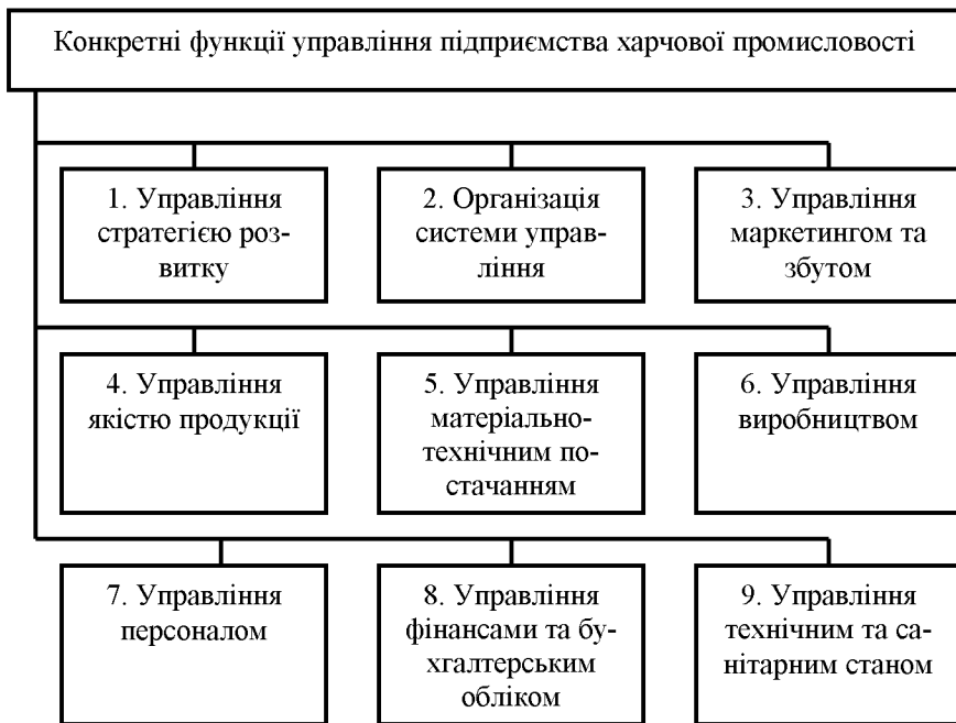
Рисунок 3 – Перелік конкретних функцій управління підприємств харчової промисловості

Найбільш складним з методичної точки зору та практичного використання, на наш погляд, є параметр сумісності.