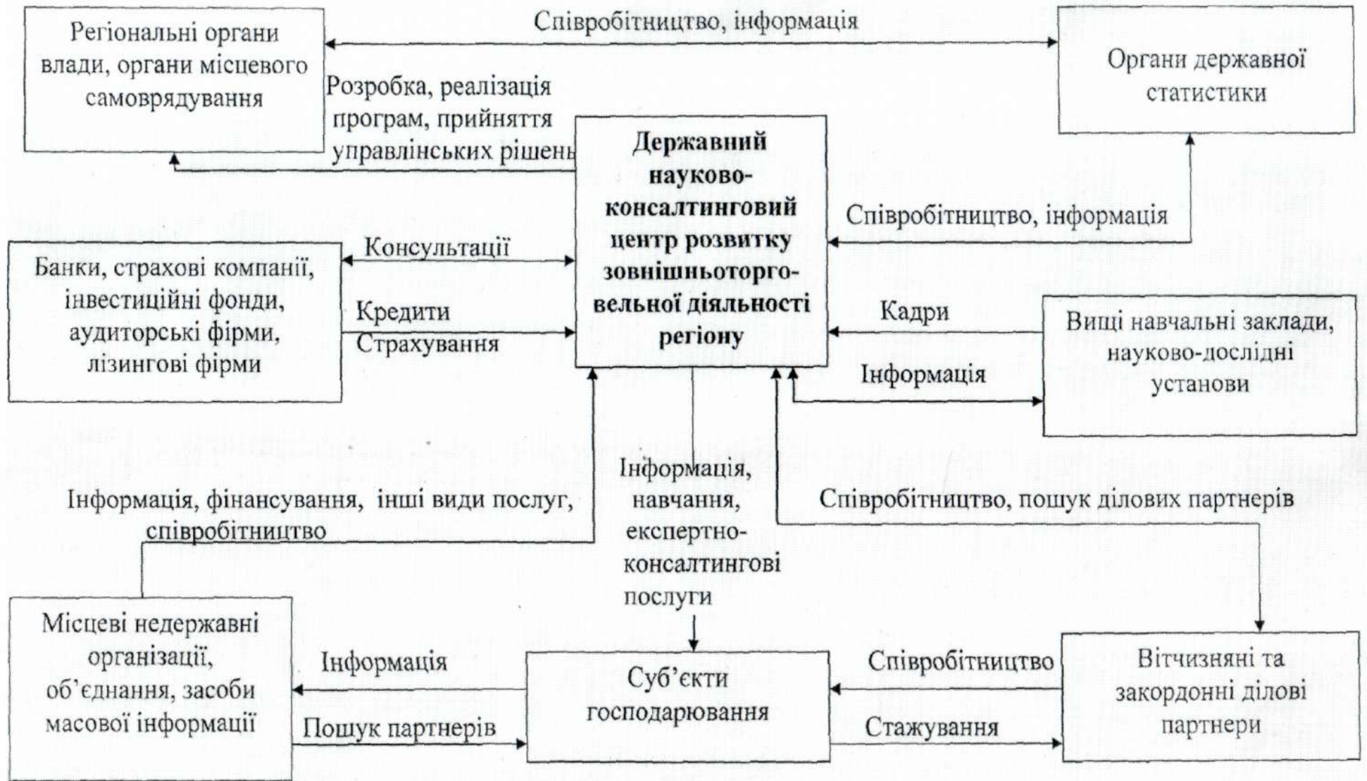
Рисунок 3 – Напрями взаємодії державного науково-консалтингового центру розвитку зовнішньоторгівельної діяльності із соціально-економічними суб'єктами та інституціями