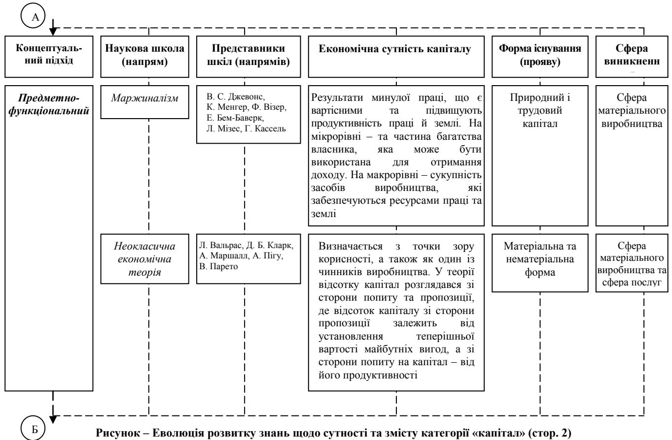
Рисунок – Еволюція розвитку знань щодо сутності та змісту категорії «капітал» (стор. 2)