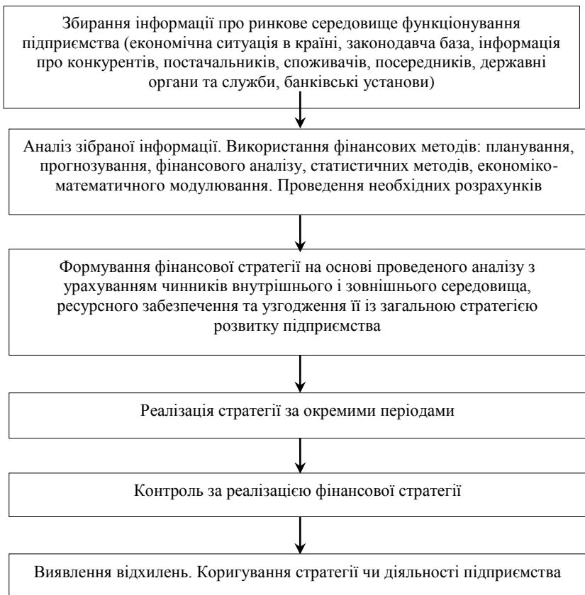
Рисунок 2 – Основні етапи формування фінансової стратегії підприємства

Успішне функціонування підприємства в ринкових умовах можливе за рахунок формування і реалізації виваженої маркетингової, фінансової та інвестиційної політики. Фінансова стратегія поєднує в собі ці складові та за допомогою реалізації оперативних і поточних планів дає змогу досягнути запланованих цілей. Фінансова стратегія має бути чіткою, логічною, збалансованою та обґрунтованою.