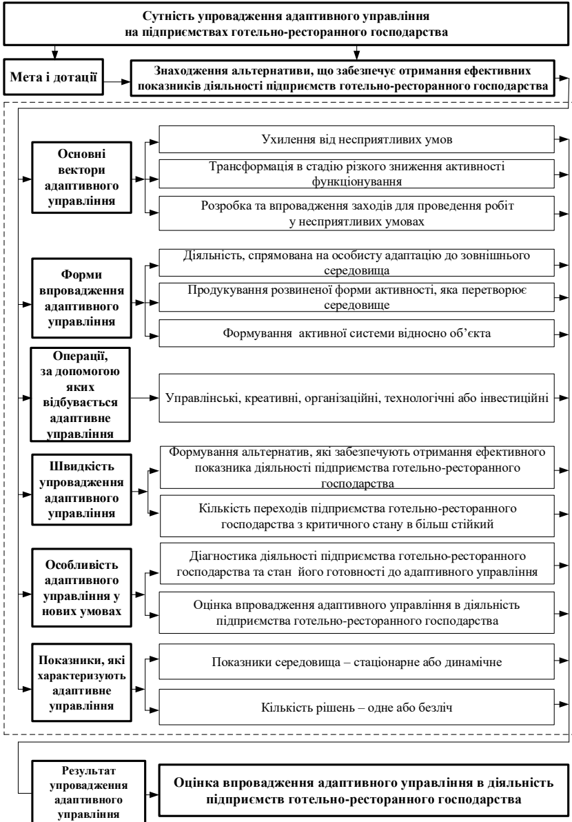
Рис. 1. Елементи адаптивного управління розвитком підприємств готельно-ресторанного господарства та їх характеристика