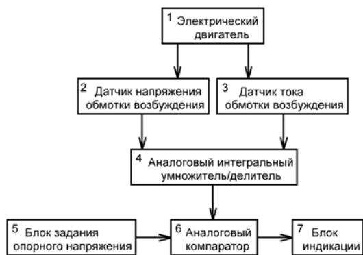
Рис. 1. Функциональная схема защиты тягового двигателя шахтного электровоза от перегрева

грев и охлаждение коррелируют между собой. Как установлено в результате проведения авторами ряда экспериментов, температура якорной обмотки на 20°C превышает температуру обмотки возбуждения. В связи с этим логичен вывод, что для контроля температурных режимов обмотки якоря возможно использование косвенного метода – путем определения