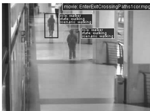
Рис. 3. Пример аннотирования кадра

Пример анализа одного кадра из видеопоследовательности с добавленной к нему аннотацией и ключевыми словами приведен на рис. 3.