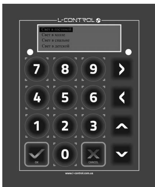
Рис. 1. Проводной блок управления системой «Умный дом»

В системах «Умный дом» прошлого поколения было принято использовать проводные блоки управления, которые представляли собой плату-контроллер, небольшой трех-четырёх строчный монохромный экран, а также средство ввода в виде кнопочной клавиатуры (рис. 1).