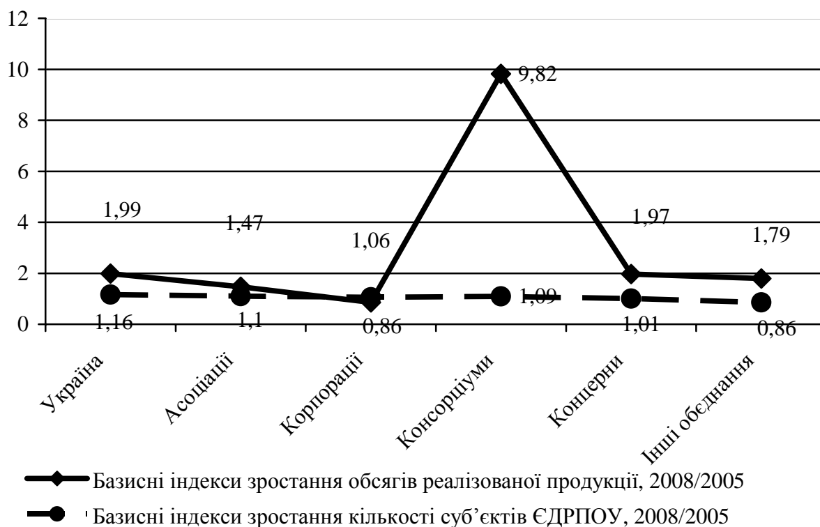
Рис. 2. Порівняльні базисні індекси (розраховано на підставі [9])

Обсяги реалізованої корпораціями продукції за 2005-2008 рр. зменшилися на 14% при зростанні кількості корпорацій на 6%. Найбільший ріст обсягів реалізованої продукції спостерігається по консорціумам – в 9,82 рази, при тому, що кількість цих об'єднань зросла лише в 1,09 раз. Але вага продукції, реалізованої консорціумами, в загальних обсягах реалізованої об'єднаннями продукції дуже низька – 2%, і тому таке значне зростання обсягів (в 9,82 рази) незначно впливає на загальну зміну обсягів реалізованої об'єднаннями продукції.